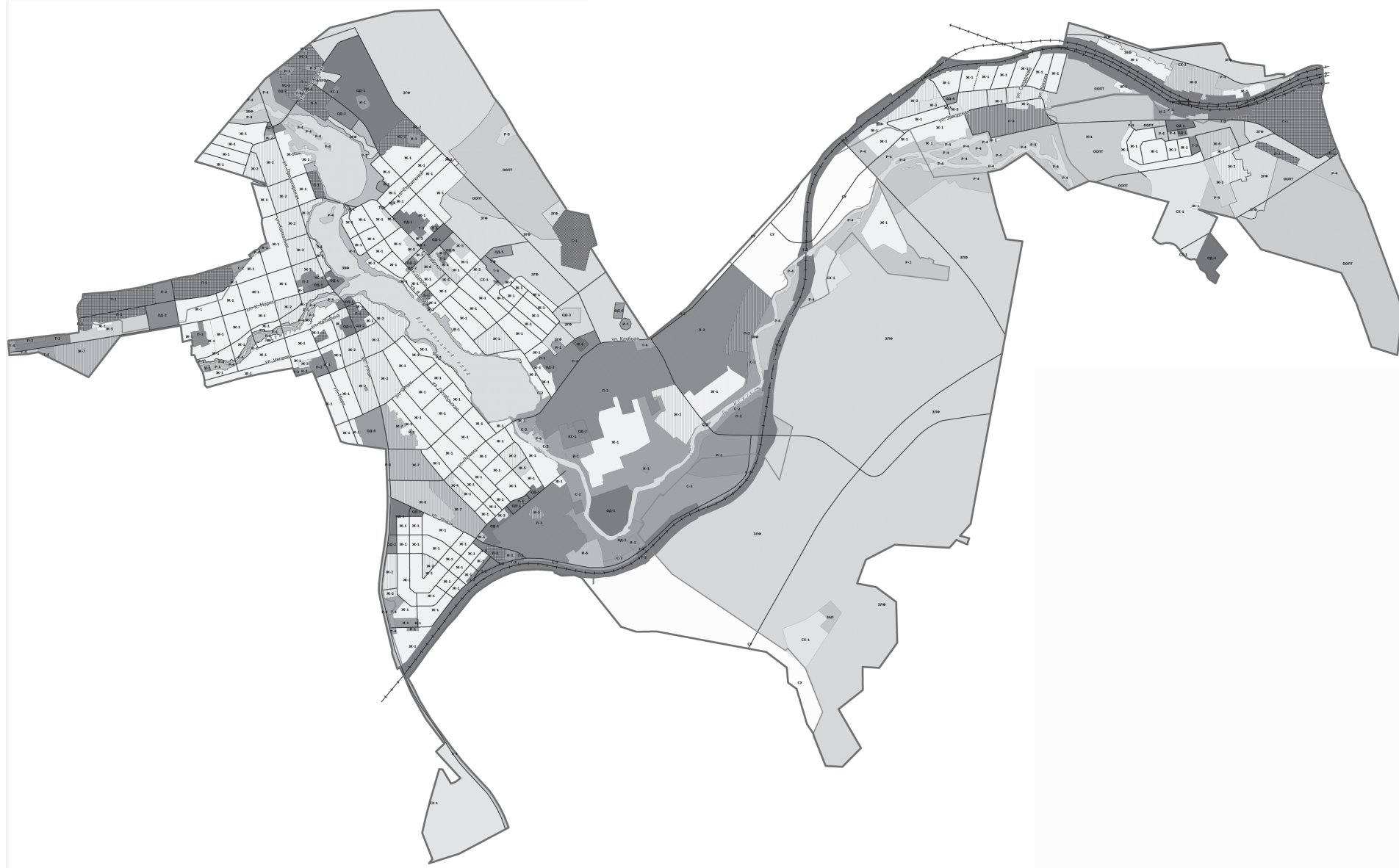
Перечень территориальных зон