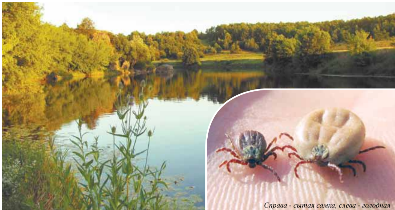
Справа - сытая самка, слева - голодная

Период от заражения до начала болезни может длиться от 3 до 21 дня (иногда до 60 дней), в среднем 10-14 дней. Обычно болезнь развивается остро, внезапно. Возникает лихорадка с подъемом температуры до 39-40,5 градусов, отмечается жар, ознобы, мучительная головная боль, ломящие боли в конечностях, поясничной области, тошнота, повторная рвота, боль в глазах. Обычно с 3-4 дня, а иногда и впервые часы болезни наблюдаются признаки поражения центральной нервной системы: двоение в глазах, судороги, слабость и онемение конечностей, нарушение сознания.