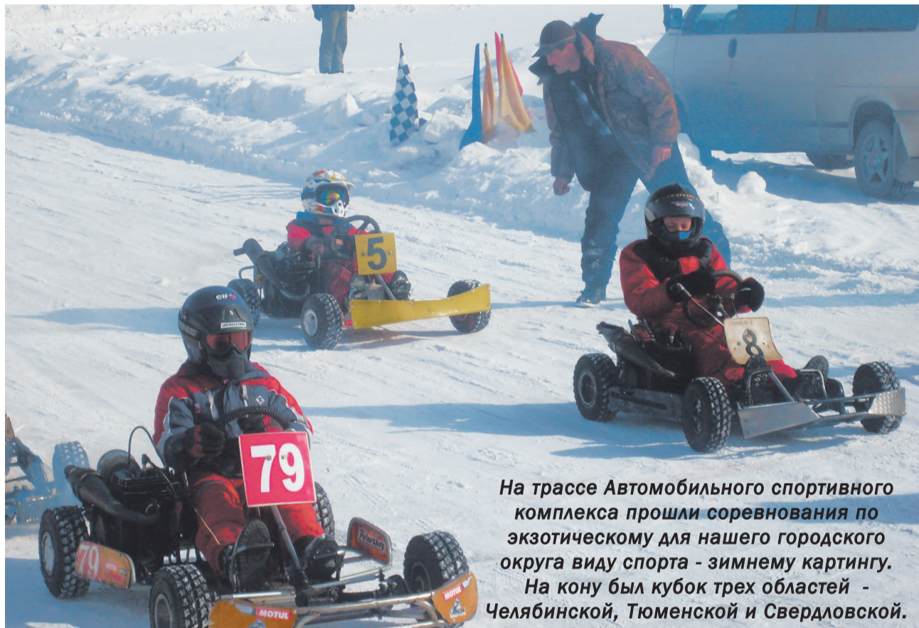
На трассе Автомобильного спортивного комплекса прошли соревнования по экзотическому для нашего городского округа виду спорта - зимнему картингу. На кону был кубок трех областей - Челябинской, Тюменской и Свердловской.