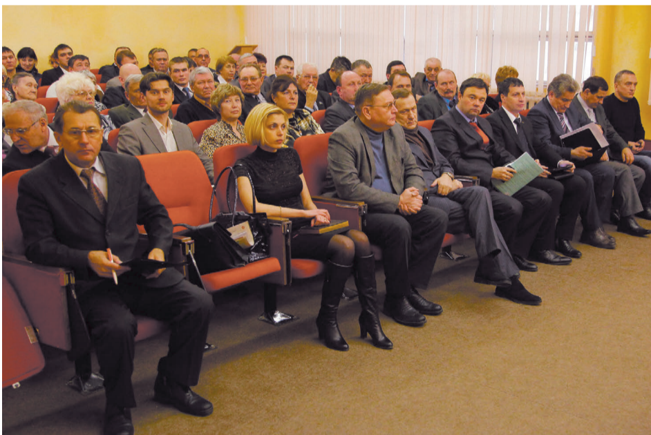
Зал с пониманием встретил идею о выдвижении единого кандидата в президенты