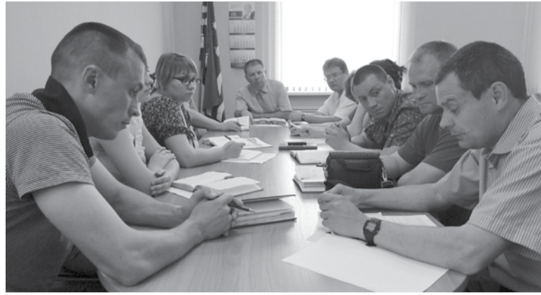
Первое заседание штаба по созданию в Арамили добровольной народной дружины

Особые «рекламные» урны для мусора планируется установить на арамилских улицах, а следить за порядком на них теперь будут дружинники. Максимум подробностей – в нашем традиционном обзоре прошедшей недели.