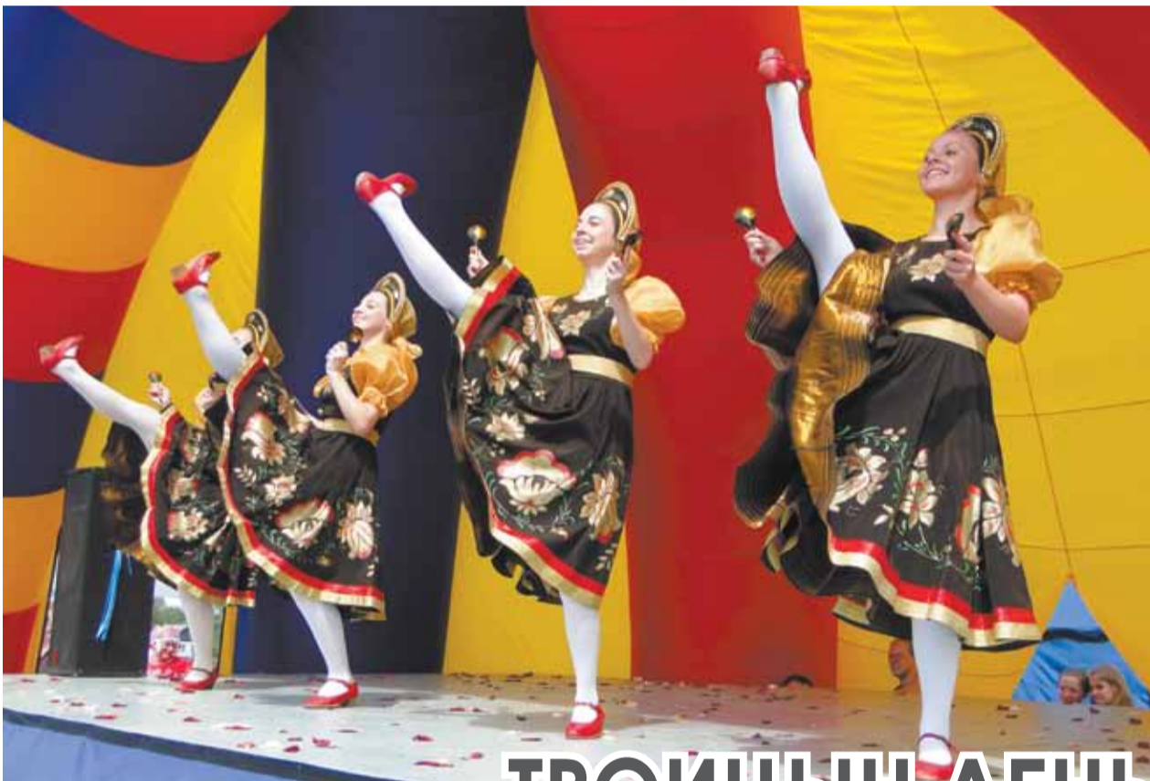
В центре внимания