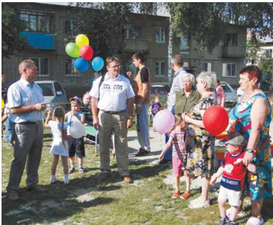
Открытие детской площадки на улице Космонавтов

В калейдоскопе минувших семи дней помимо незаконного строительства, борьбы с должниками и несбывшихся ожиданий было сразу несколько хороших новостей. Представляем наш обзор событий прошедшей недели.