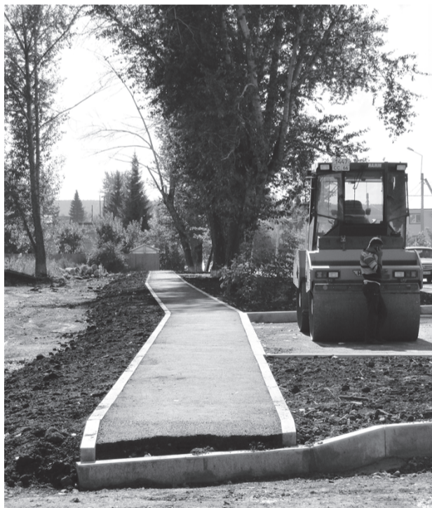
Рядом с магазином «Пеликан» понижение тротуара сделают после того, как будет уложен последний слой асфальта

По поводу тротуаров, бордюров и всего остального. Высокие тротуары делаются для того, чтобы на них не скапливалась вода, остановочные площадки подняты в соответствии с действующими нормами. В местах, где тротуар примыкает к дороге, выполнено необходимое понижение. Если говорить о тротуаре рядом с Дворцом культуры, то работы еще ведутся, со временем здесь появятся ступени. Ширина тротуара составляет полтора метра – две коляски