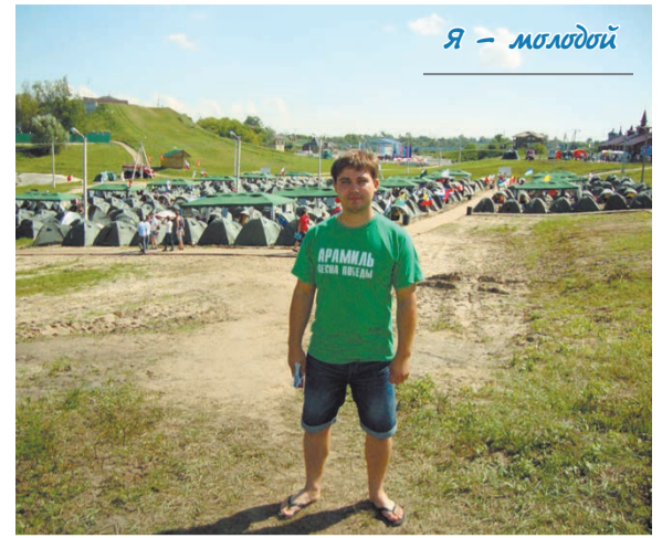
Я – молодой