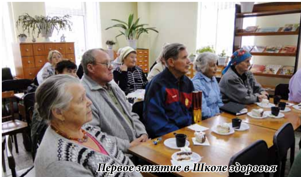
Первое занятие в Школе здоровья