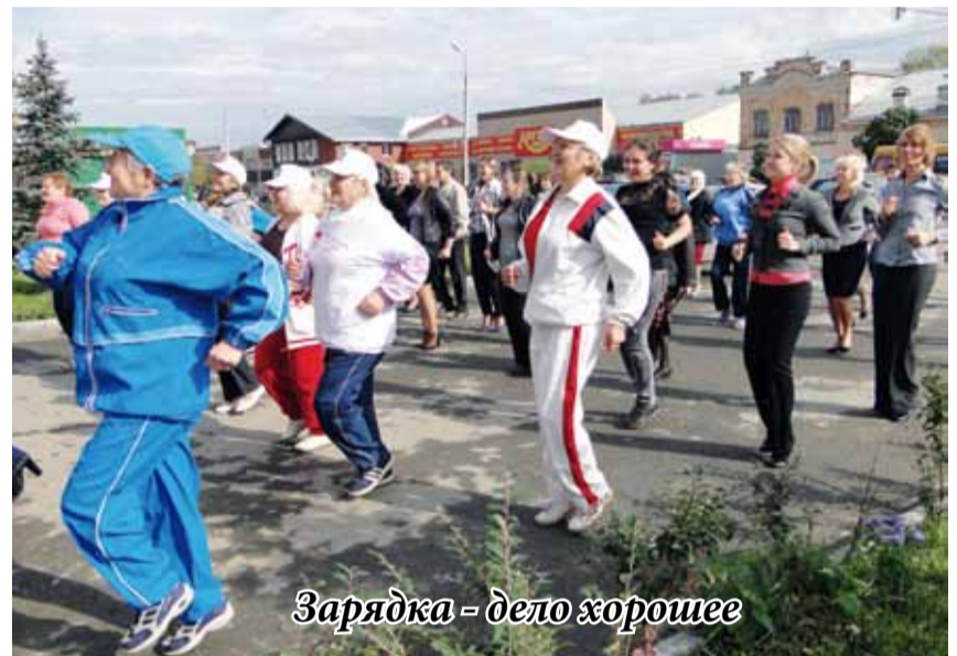
Зарядка - дело хорошее