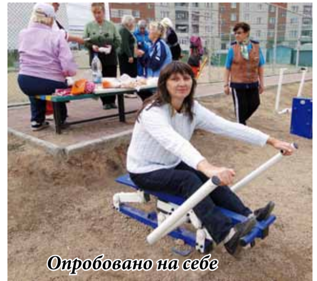
Опробовано на себе