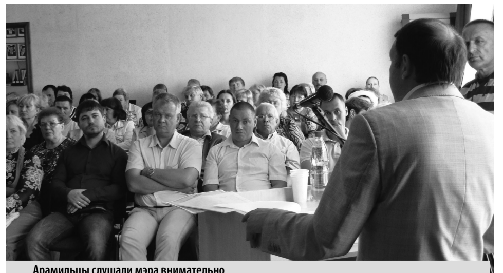
Арамилцы слушали мэра внимательно