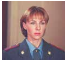
23.30 «РЕПОРТЕРСКИЕ ИСТОРИИ» (16+) 00.00 «НЕДЕЛЯ С МАРИАННОЙ МАКСИМОВСКОЙ» (16+) 01.15 СМОТРЕТЬ ВСЕМ! 02.15 «ПРЕДСТАВЬТЕ СЕБЕ» (16+) 02.45 ФАНТАСТИЧЕСКИЙ ТРИЛЛЕР «ЗАЛИВ» (16+) 04.30 «ДАЛЬНИЕ РОДСТВЕННИКИ» (16+)