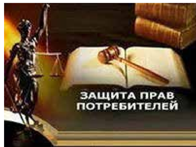
График работы: понедельник с 10.00 до 12.00.

Записаться на прием можно по тел. 8(34374) 3-17-11 или по адресу г. Арамил, ул. 1 Мая, 12 (кабинет 11).