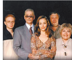
00.40 «ЛЕГЕНДЫ РЕТРО FM» ЛУЧШЕЕ (16+)

6.00 МУЛЬТФИЛЬМЫ 8.00 ШКОЛА ДОКТОРА КОМАРОВСКОГО 8.30 Х/Ф «НОВЫЕ ПРИКЛЮЧЕНИЯ НЕУЛОВИМЫХ»