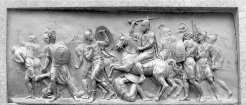
Победа народного ополчения над поляками. Горельеф с памятника Минину и Пожарскому

По всей России прошли праздничные гуляния, концерты и представления. В сердце праздника — Нижнем Новгороде в этот день открыли реконструированную улицу Рождественская, которая теперь стала наполовину пешеходной. По статистике, 80 % населения все еще не знают, что это за праздник, но поддерживают его и с удовольствием отмечают.