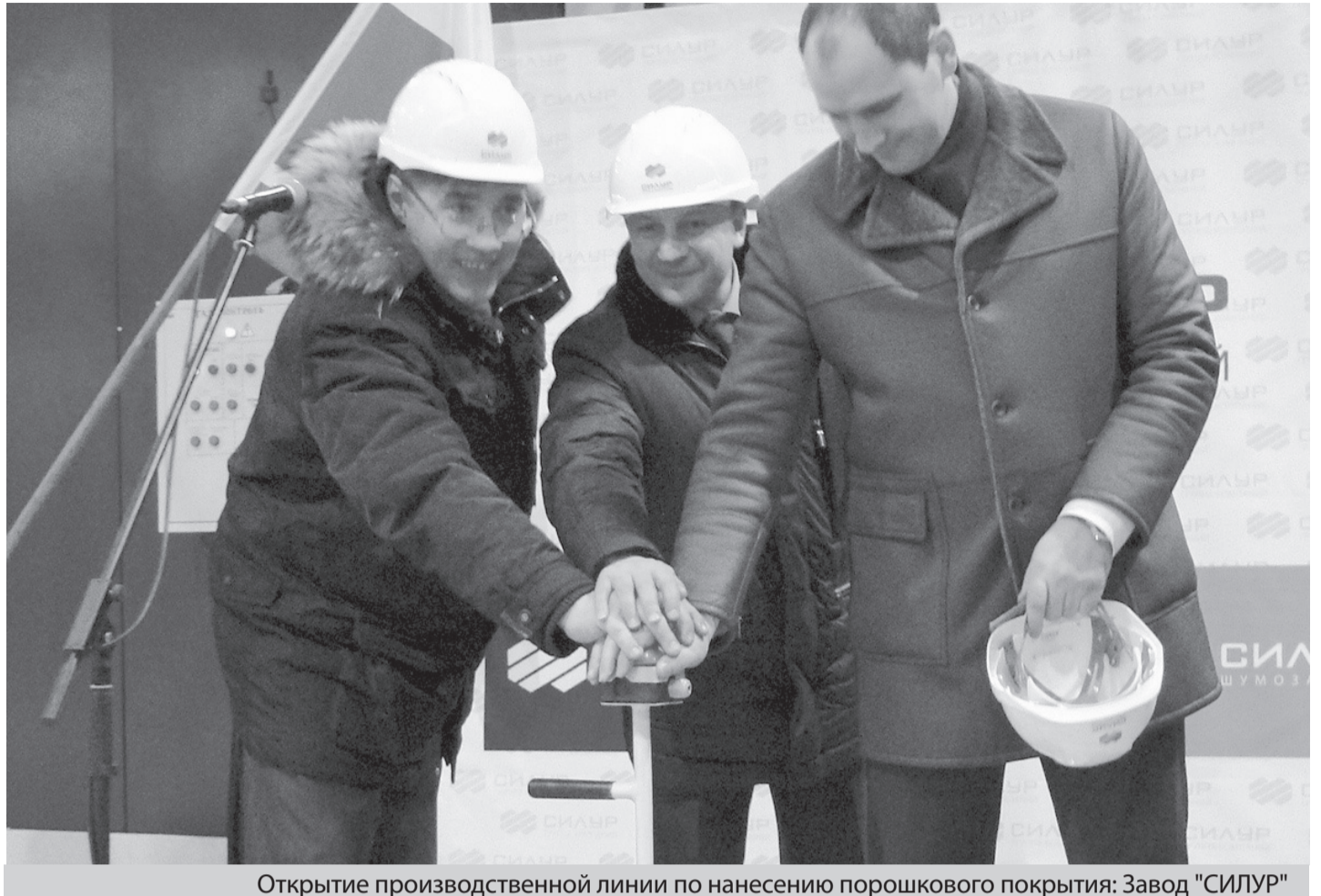
Открытие производственной линии по нанесению порошкового покрытия: Завод "СИЛУР"

В процессе общения с администрацией предприятия Денис Паслер все время интересовался, чем руководство области может помочь его дальнейшему развитию. Помимо мер административного свойства, премьер пообещал решить и некоторые проблемы, напрямую влияющие на конкурентоспособность и экономическую стабильность завода. Выяснилось, что себестоимость продукции Уралпластика серьезно зависит от качества оборудования, на котором она производится. К примеру, прокатные валы, используемые в производстве полиэтиленовой пленки, Уралпластик-Н закупает в других регионах России, несмотря на то, что в Свердловской области подобная продукция выпускается. На вопрос премьера, почему покупается не местное, руководители завода ответили, что рады бы, но качество их не устраивает. Это стало поводом для появления