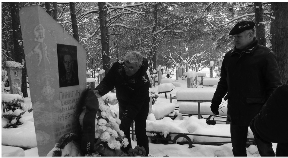
К могилам погибших воинов торжественно возложили венки

Митинг-реквием, посвящённый 25-летию вывода советских войск из Афганистана и памяти погибших воинов, начался ровно в полдень, 15 февраля. В мероприятии приняли участие сами «афганцы», их близкие, а также родственники погибших воинов, представители администрации города, военкомата и ветеранских организаций, местный священник, учителя, школьники и просто неравнодушные жители. По словам тех, кто ежегодно бывает на Дне памяти воинов-интернационалистов, участников митинга в этот раз было гораздо больше, чем в прошлые годы.