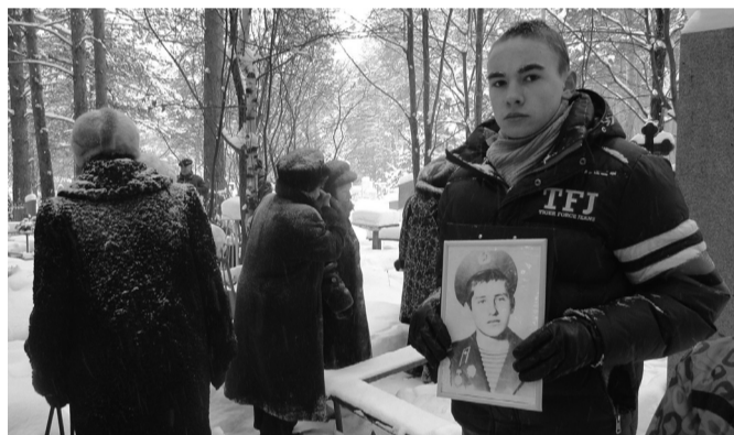
Школьники с портретами воинов-афганцев

...Советские войска вошли в Афганистан в конце декабря 1979 года — для поддержки правительственных сил, борющихся с различными вооружёнными формированиями на территории Афганистана. За десять лет там побывали приблизительно