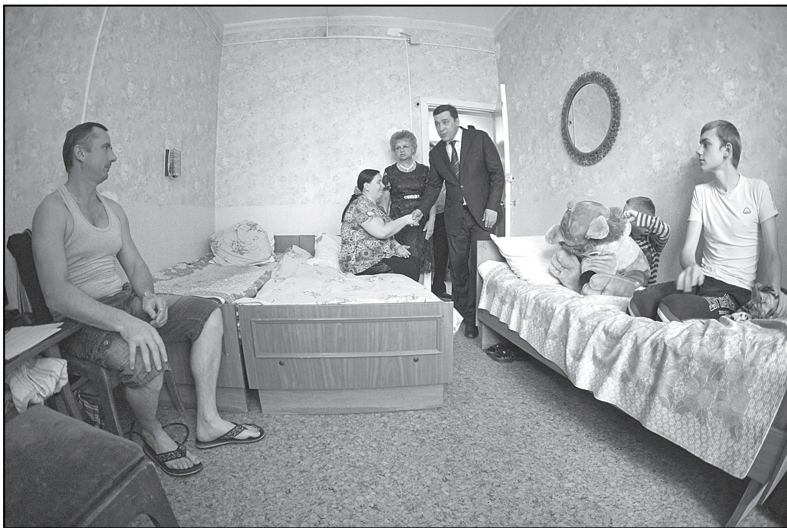
В пункте временного размещения в Берёзовском все обустроено довольно скромно, но для тех, кто бежал от войны, это значительно лучше, чем жить под постоянным напряжением в ожидании бомбежек или обстрела.

К сожалению или счастью, но о тех, кто придет к нам в город, мы узнаем в лучшем случае накануне, а то и за несколько часов