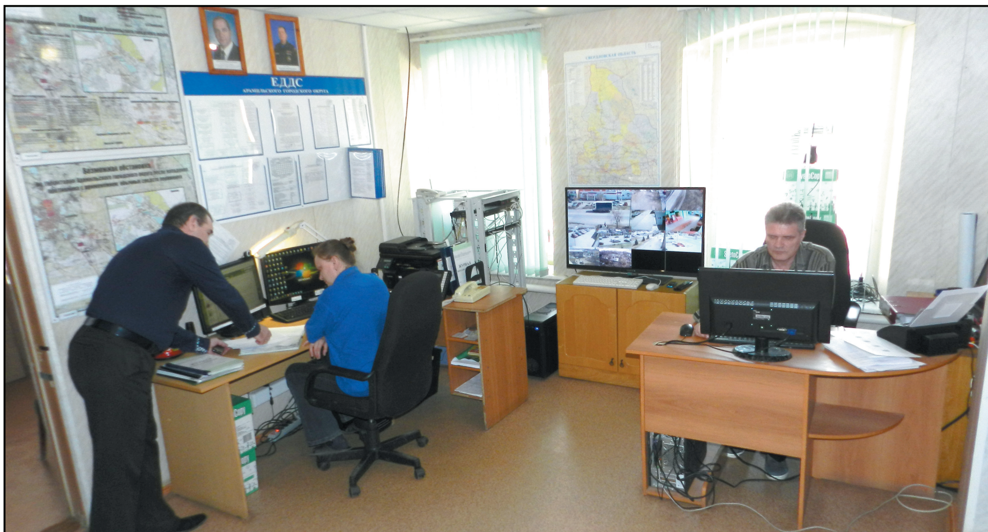
В офисе Единой дежурно-диспетчерской службы все спокойно: день только начинается! Чаще всего утром и днем звонят сюда домохозяйки и пенсионеры, а ближе к вечеру - социально-активные жители, возвращающиеся с работы...