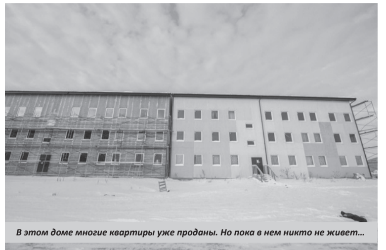
В этом доме многие квартиры уже проданы. Но пока в нем никто не живет...