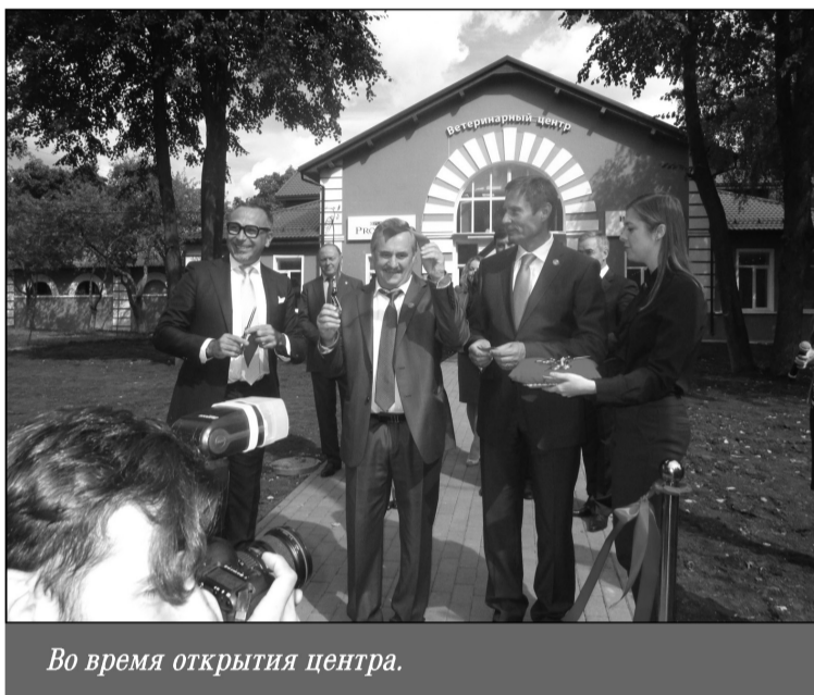
Во время открытия центра.

— Мы гордимся, что «Нестле Пурина» стала частью этого уникального проекта. В центре для нас создана уникальная возможность делиться нашим вековым опытом. Как эксперт в области питания и ухода за домашними животными, «Пурина» активно поддерживает инициативы, направленные на развитие ветеринарной профессии в России. Для нас особенно важно, что инновационный центр будет специализироваться на лечении домашних животных, ведь в настоящее время есть насущная потребность развивать это направление в