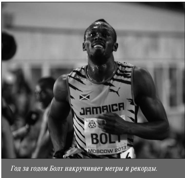
Год за годом Болт накручивает метры и рекорды.

— Всегда хотелось поиграть в футбол. Но сейчас у меня мысли только о легкой атлетике. Поскольку я планирую уйти из спорта в 30 лет, то, значит, могу съездить и в Рио-2016.