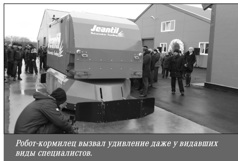
Робот-кормилец вызвал удивление даже у выдавших виды специалистов.