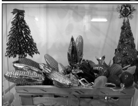
Для детишек такие «антикварные» игрушки, прямо скажем, в диковинку.

повсюду «королеву полей», модными стали яркие жёлто-зелёные початки.