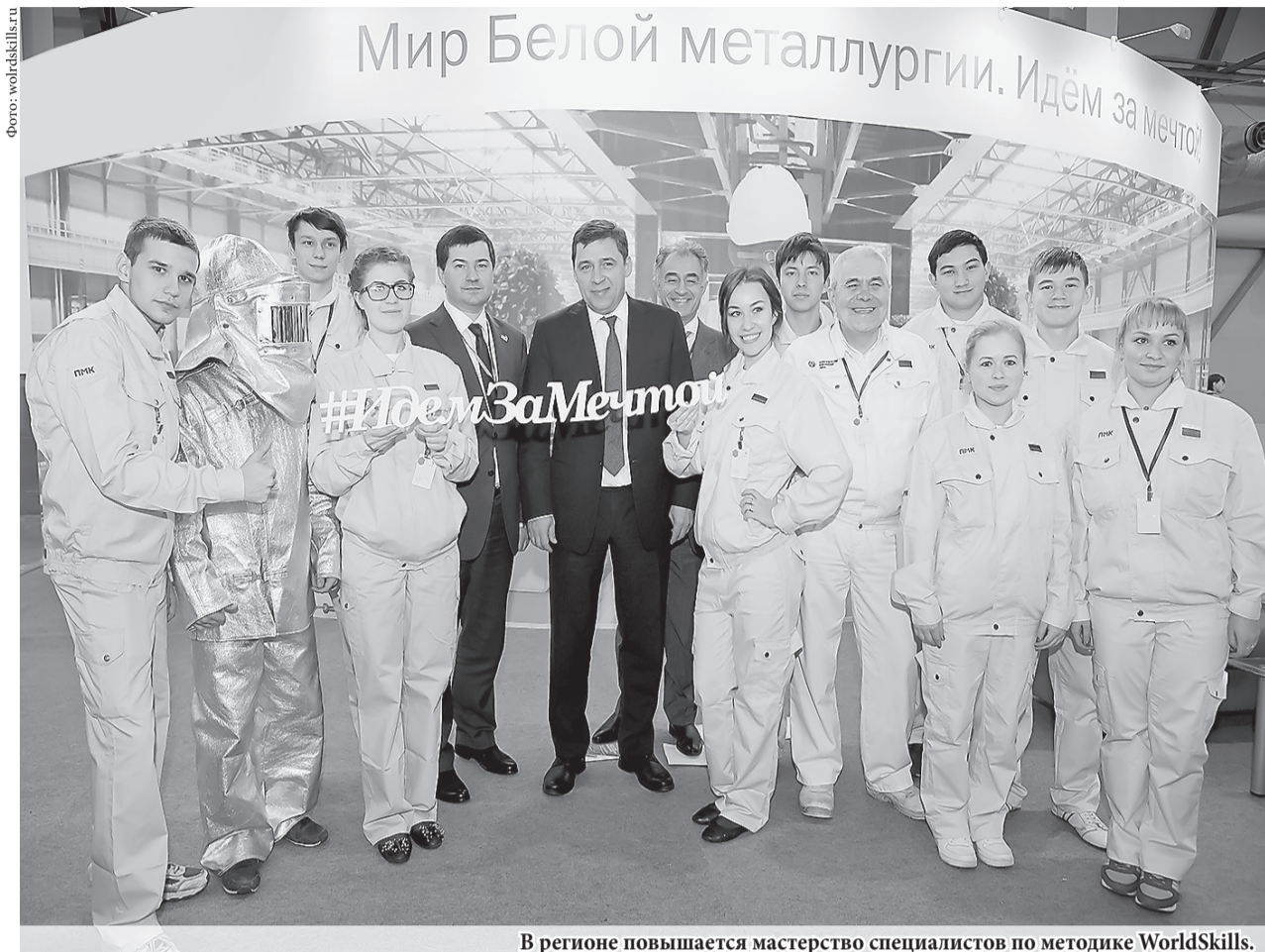
В регионе повышается мастерство специалистов по методике WorldSkills.

Один из резидентов технопарка – компания «НЕКСАН» планирует разместить высокотехнологичное производство промышленных теплообменников. Ещё один резидент – НПО «БиоМикроГели» – будет производить средства для очистки воды и твёрдых поверхностей от комплексных загрязнений, а также бытовую химию.