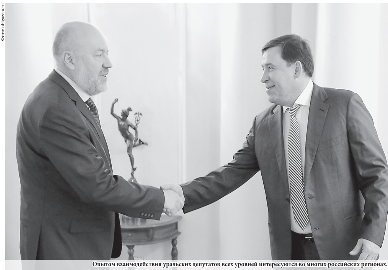
Опыт взаимодействия уральских депутатов всех уровней интересуются во многих российских регионах.

Евгений Куйвашев и Павел Крашенинников также обсудили подготовку к единому дню голосования