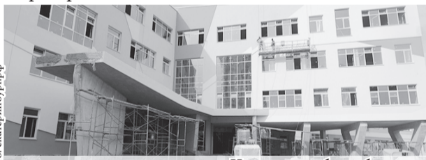
Новых школ будет больше.

В настоящее время в Екатеринбурге идёт строительство второй очереди школьного комплекса в Академическом районе, в посёлке Мичуринский возводится образовательный центр, а в Полевском – пристройка к школе №14.