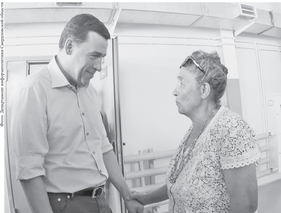
Учреждённый главой области Евгением Куйвашевым в 2013 году праздник – День пенсионера – стал социально значимой инициативой, получившей широкую поддержку уральцев.

На теплоходе «Александр Фадеев» в сентябре 2017 года 65 человек отправятся в Самару, Саратов, Волгоград, Елабугу, Ульяновск, Сарапул. Они проведут встречи с ветеранами, молодёжью, представителями органов власти, возложат цветы, венки к памятникам, обелискам.