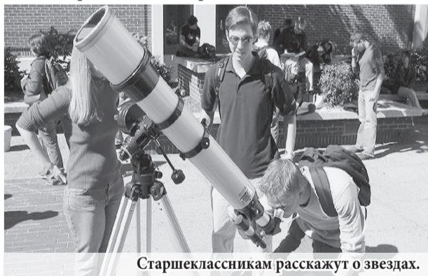
Старшеклассникам расскажут о звездах.

Одним из нововведений в 2017-2018 учебном году станет появление в школьном расписании астрономии. Как отмечают в региональном министерстве образования, пока не внесены изменения в базисный учебный план, но рекомендации министерства образования и науки России уже доведены до школ. Планируется, что новая дисциплина по решению школ появится в расписании учеников 10-11 классов. Предполагается, что повышение квалификации педагогов будет проводиться в Институте развития образования Свердловской области.