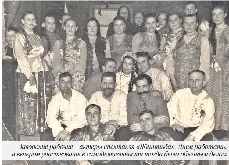
Заводские рабочие – актеры спектакля «Женитьба». Днем работать, а вечером участвовать в самодеятельности тогда было обычным делом

В крупных селах и рабочих поселках имелись сельские клубы или дома культуры, в деревнях же в тот период основным видом культурно-просве-