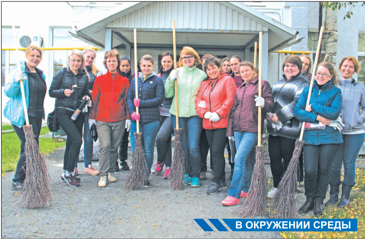
В ОКРУЖЕНИИ СРЕДЫ