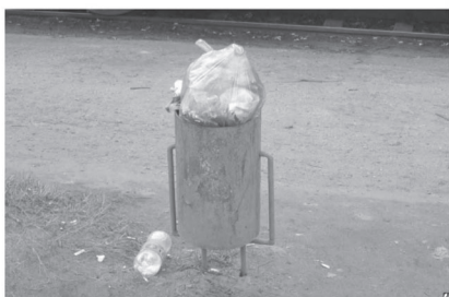
В урне куча бытовых отходов? Это дело моральных ...

Лица, выбрасывающие в урны мешки с мусором, будут привлечены к административной ответственности.