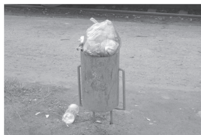
В урне куча бытовых отходов?! Это дело моральных ...

Лица, выбрасывающие в урны мешки с мусором, будут привлечены к административной ответственности.