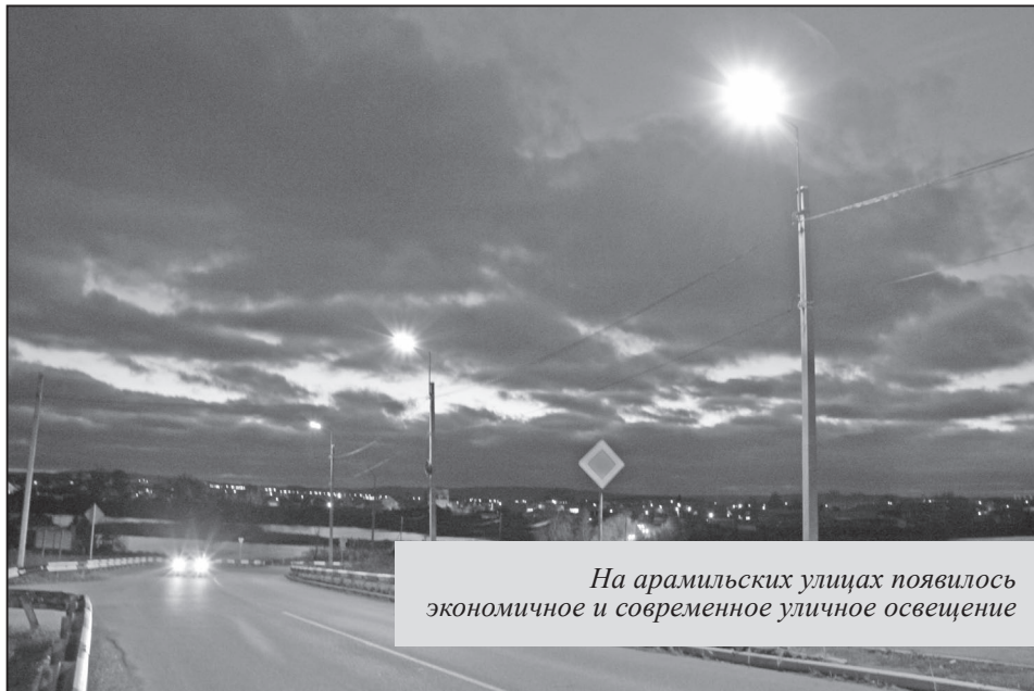
На арамилских улицах появилось экономичное и современное уличное освещение

Из-за кредиторской задолженности у нас были очень большие дол-