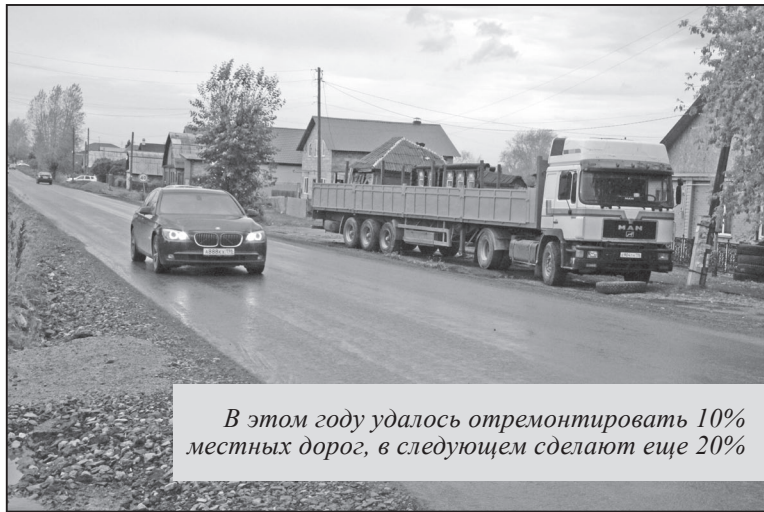
В этом году удалось отремонтировать 10% местных дорог, в следующем сделают еще 20%

Особое внимание мы уделили развитию левобережья, поскольку там аккумулировано более 80% ветхого и аварийного жилья. Сегодня заключен договор развития застроенной территории на десять лет, и по дорожной карте в ноябре застройщик уже должен выйти на стройку в районе домов №114 и №116