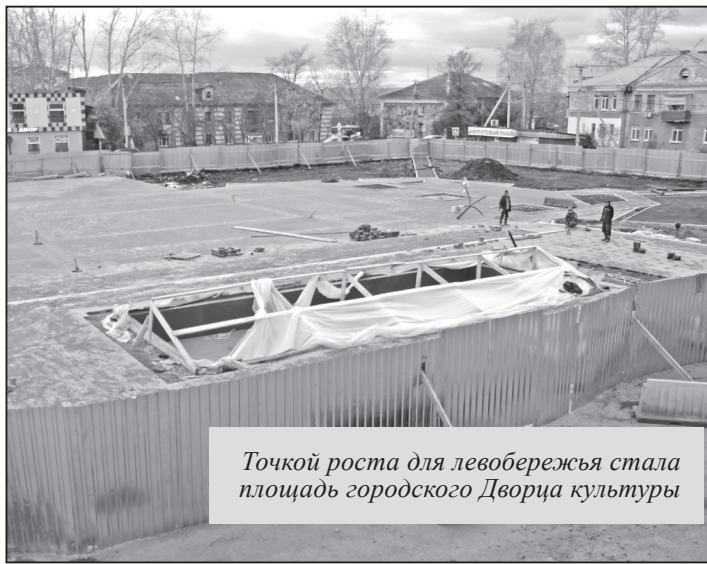
Точкой роста для левобережья стала площадка городского Дворца культуры

Я считаю, самое интересное из того, что произойдет в следующем году — это строительство школы на 1000 мест на улице Рабочей. Это уже вопрос решенный, было потрачено очень много времени на приведение в соответствие документов, и, чтобы добиться здесь результата, лично мне пришлось потратить массу сил. По итогам согласительной комиссии в областном правительстве нам уже утвердили долю софинансирования на первый этап строительства. Планируется конкурс провести в декабре через департамент госзакупок, а в марте начать строить физически. Сейчас ждем корректировку программы 2018 года по министерству, куда включает нашу школу, чтобы нам довели лимиты, и не пришлось терять время. Школа объект