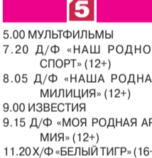
21.00 РЕШАЛА (16+)