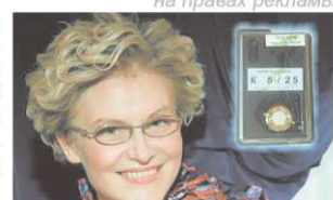
«Карманный доктор действительно помогает». Е. Малышева

И что особенно важно, применение "Карманного доктора" позволяет экономить деньги, которые вы тратите на лекарства, что очень важно для пенсионеров.