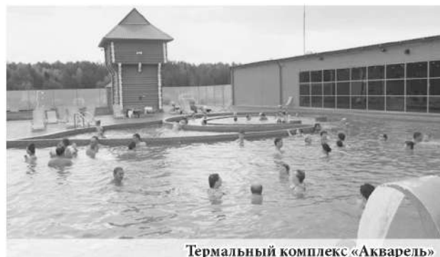
Термальный комплекс «Акварель»

В городе существует ещё одна точка притяжения для гостей региона – термальный комплекс «Акварель». Евгений Куйвашев некоторое время назад посетил эти источники и отметил, что они имеют все шансы, чтобы стать важным звеном в развитии туристического потенциала Свердловской области.