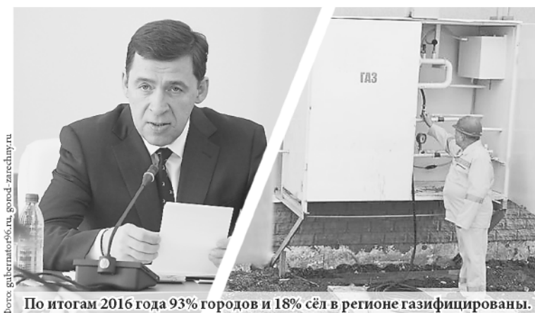
По итогам 2016 года 93% городов и 18% сёл в регионе газифицированы.

По поручению Евгения Куйвашева в Свердловской области будет расширен перечень получателей льгот на подключение жилых домов к сетям газоснабжения. Подготовку документов, предусматривающих соответствующие положения, министерство социальной политики региона завершит до 26 мая.