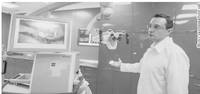
Департамент информполитики губернатора Свердловской области

После капремонта в ГКБ №40 открылся операционный блок нейрохирургической службы. Как отметил глава региона Евгений Куйвашев , больница превращается в городской, региональный и межрегиональный центр, который позволит увеличить количество операций на 20%. «Электронные микроскопы позволяют отличать опухолевые ткани от здоровых. У нас появилась видеотрансляция изображений с микроскопа на монитор. Это даёт возможность для обучения молодых специалистов», – рассказал главврач Александр Прудков .