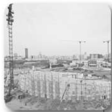
Начата реконструкция стадиона «Екатеринбург-Арена» к ЧМ-2018

На параде Победы миру представлен танк Т-14 «Армата» (УВЗ)