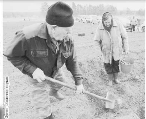
Фото: «Золотая горка»