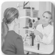
Открылись филиалы МНТК «Микрохирургия глаза»

Область вошла в 10 лидеров РФ по производству молока