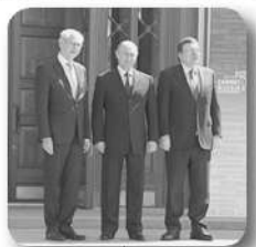
Саммит РФ-ЕС в Екатеринбурге