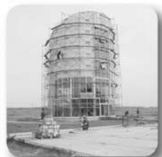
Началось строительство ОЭЗ «Титановая долина»