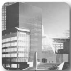
Открыт «Президентский центр Б.Н. Ельцина»

Область вошла в 10 лидеров РФ по производству молока