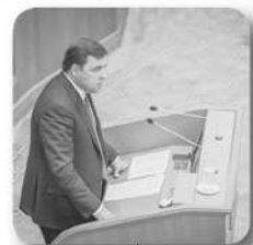
1-я программная статья «Сохраним опорный край Державы»