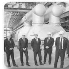
Пуск крупнейшей в мире теплофикационной паровой турбины (УТЗ)

Капремонт МКД переведён на круглогодичный цикл