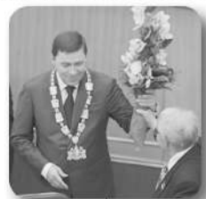
Евгений Куйвашев назначен губернатором Свердловской области

Кроме того, Свердловская область участвует в формировании Евразийского транспортного коридора, который соединит европейскую часть России с Китаем и другими странами азиатского континента.