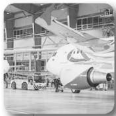
Открылся авиационно-технический центр

ном чемпионате сквозных рабочих профессий WorldSkills. Прошедший в прошлом году в Екатеринбурге чемпионат собрал более 300 специалистов из 100 ведущих компаний страны. На протяжении нескольких лет в регионе успешно работает программа «Уральская инженерная школа». Свердловский проект «Славим человека труда» получил статус окружного.