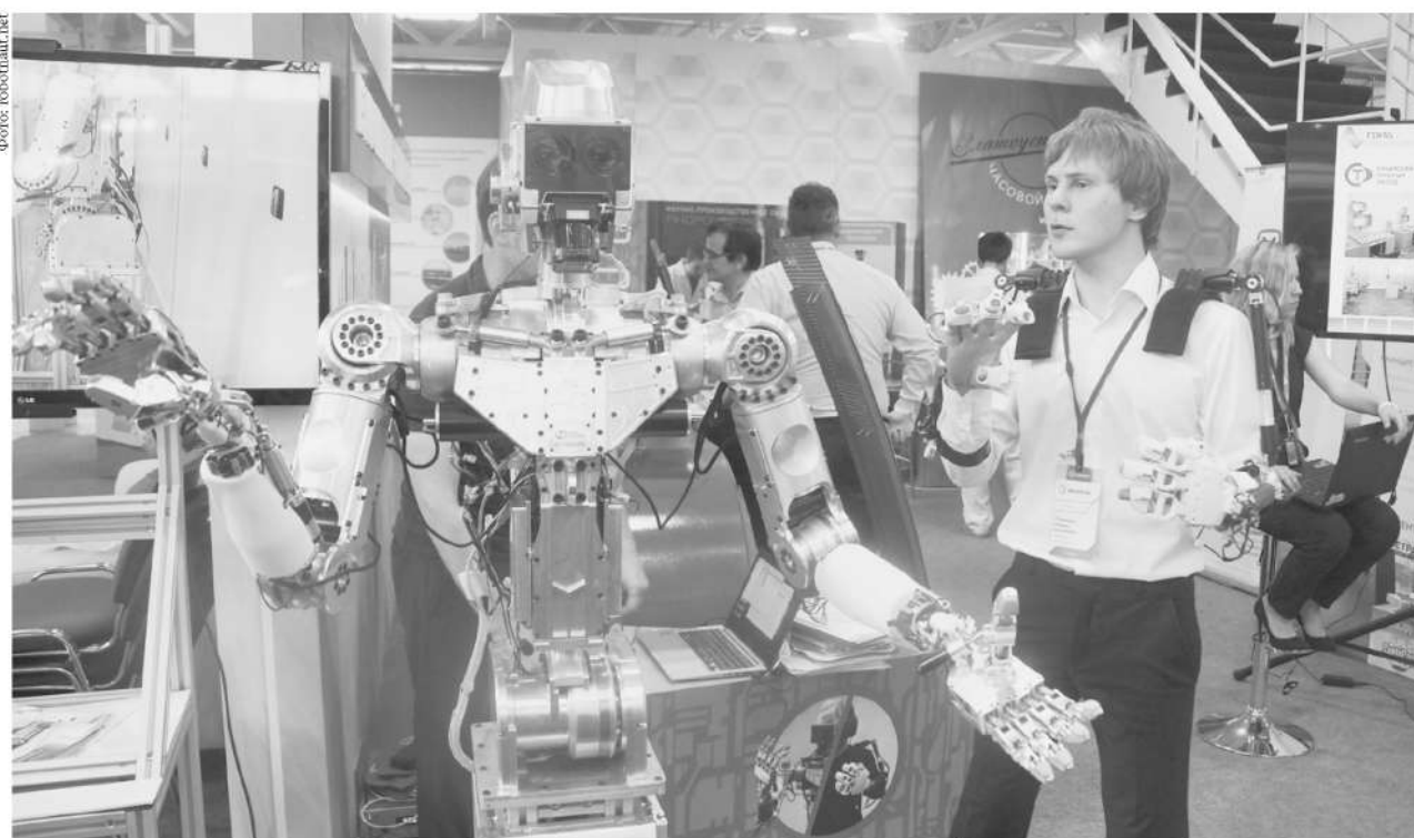
Создание полностью автоматизированного производства — главный тренд современной промышленности.

В этом году на выставку приедет более 400 представителей японской промышленности, бизнеса и власти. В национальной экспозиции будут представлены Toyota, Mitsubishi, Toshiba, Kawasaki Heavy Industries, Marubeni, Sojitz, JGC,