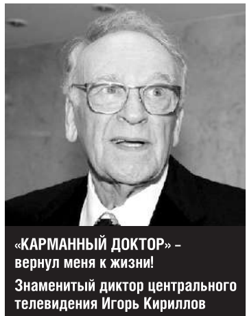
«КАРМАННЫЙ ДОКТОР» – вернул меня к жизни!

Счастье – это быть здоровым. Вы согласны? Ибо без здоровья нет, сил радоваться жизни. И даже для счастья в личной и семейной жизни и успеха в работе нам непременно нужно здоровье! Как обрести его, знают те, у кого есть «КАРМАННЫЙ ДОКТОР», творящий настоящее волшебство!