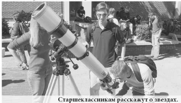
Старшеклассникам расскажут о звездах.

Одним из нововведений в 2017-2018 учебном году станет появление в школьном расписании астрономии. Как отмечают в региональном министерстве образования, пока не внесены изменения в базисный учебный план, но рекомендации министерства образования и науки России уже доведены до школ. Планируется, что новая дисциплина по решению школ появится в расписании учеников 10-11 классов. Предполагается, что повышение квалификации педагогов будет проводиться в Институте развития образования Свердловской области.