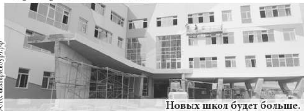
Новых школ будет больше.

В настоящее время в Екатеринбурге идёт строительство второй очереди школьного комплекса в Академическом районе, в посёлке Мичуринский возводится образовательный центр, а в Полевском – пристрой к школе №14.