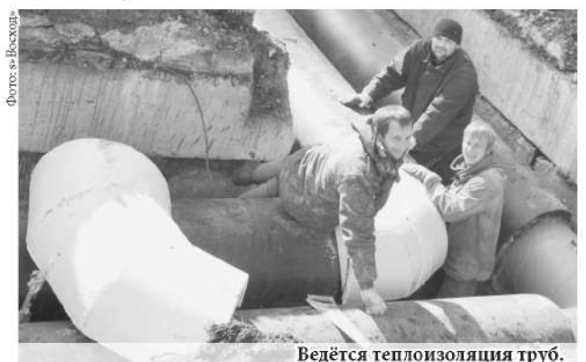
Ведётся теплоизоляция труб.

На главный вопрос «о парилке» специалист ответил, что свою работу они выполняют качественно и отвечают за неё стопроцентно. Проблема горожан решается, а это значит, что власти действуют в правильном направлении теплосбережения.