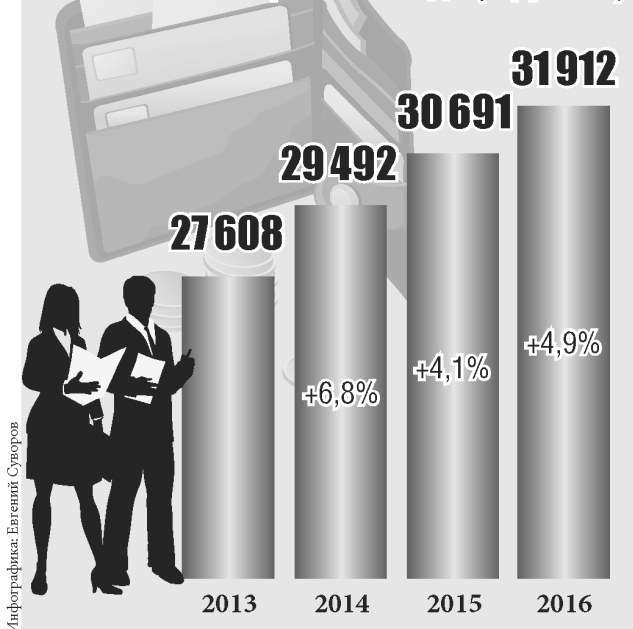
Рост среднемесячной зарплаты с 2013 по октябрь 2016 года (в рублях)

помогает финансовыми средствами федеральный центр? Это неправильная формулировка.