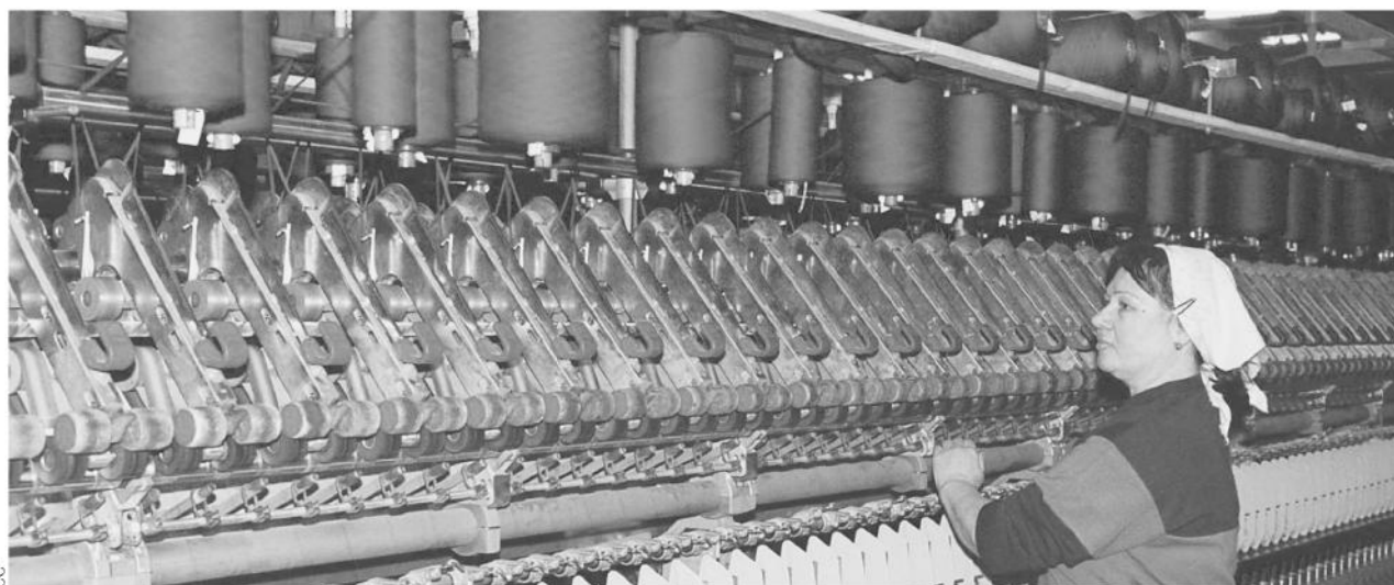
«Свердловский камвольный комбинат» при поддержке облправительства получил в 2016 году субсидию из федерального бюджета в размере 104 млн. рублей на компенсацию затрат на изготовление полушерстяной ткани для школьной формы.

В нашем регионе используются все возможные меры финансовой поддержки бизнеса: действует областной Фонд поддержки предпринимательства, предоставляющий, в том числе, возвратную поддержку с помощью своего гарантийного фонда, используется механизм компенсации кредитной ставки. Ещё одна форма помощи уральскому бизнесу – Совет по поддержке инвестиционных проектов. Это площадка, на которой инвесторы могут презентовать свои проекты представителям банковского сообщества в присутствии руководителей областных ведомств, институтов развития и деловых союзов.