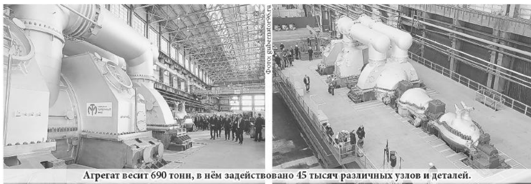
Агрегат весит 690 тонн, в нём задействовано 45 тысяч различных узлов и деталей.

730 тыс. уральцев пройдут диспансеризацию в 2017 году. На эти цели из системы ОМС направят 1,3 млрд. рублей. Программа может состоять из обязательных консультаций и анализов, а также – углублённых исследований для постановки точного диагноза.