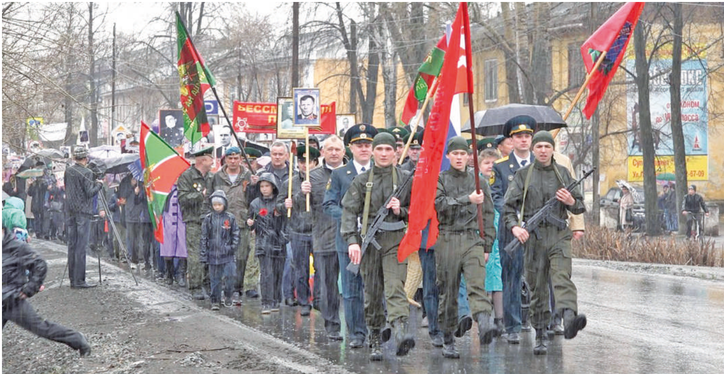
9 Мая артемовцы отметили 73-ю годовщину Победы советского народа в Великой Отечественной войне. Сотни жителей приняли участие в торжественном митинге и в шествии «Бессмертного полка», шагая плечом к плечу под проливным дождём.