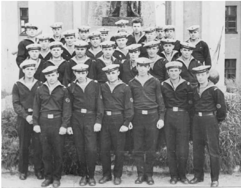
Экипаж-одна семья. г. Токмарки

Потом начались всякие испытания на воде, всплытия и всё прочее. Служба прошла тяжело, но очень памятно. Ностальгия иногда такая – смотришь на море, на воду, так хочется снова окунуться, услышать ревуна, команду: «Срочное погружение! Клапана, вентля, кингстоны,