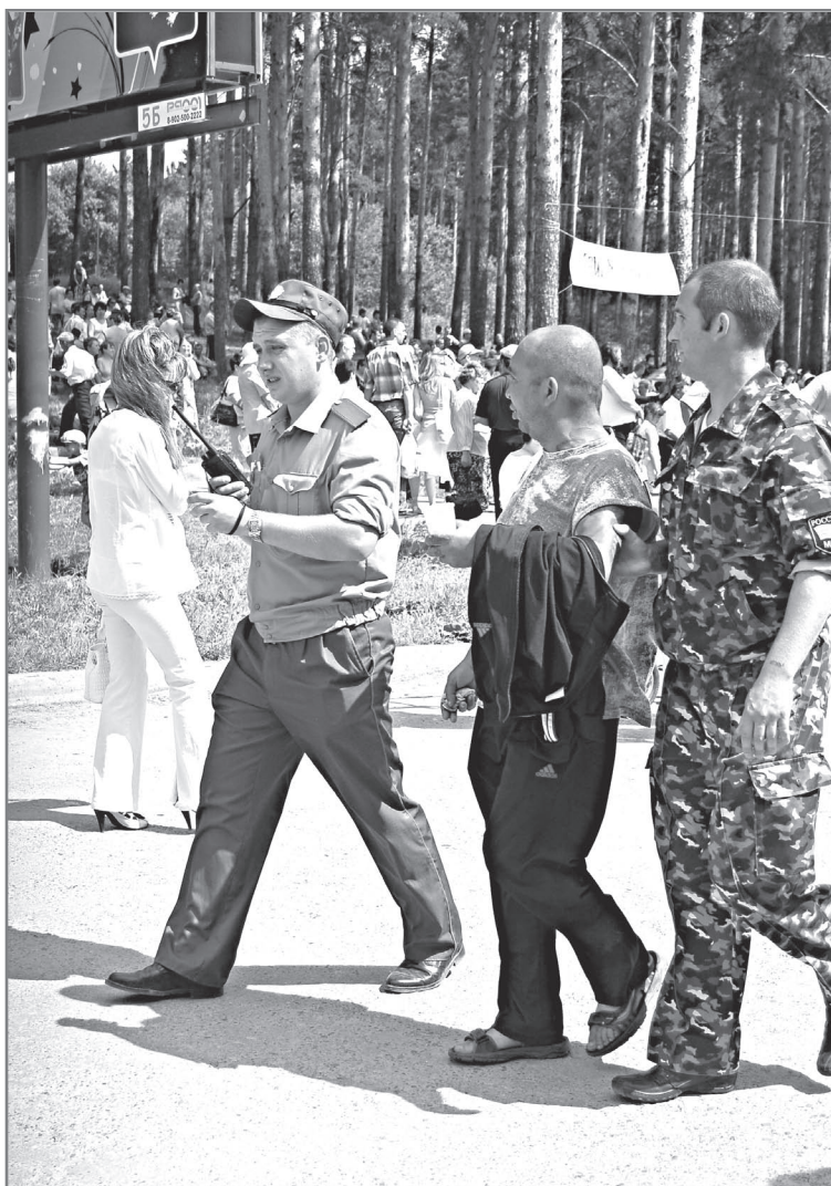
Во время больших городских праздников работы у милиции только добавляется

Краж в дачных домиках, которые в прошлом году не давали городу спокойно спать, в этом году стало меньше почти наполовину, их зарегистрировано 38. Но снизился и процент раскрываемости по ним, теперь он составляет 38% (был 66%).