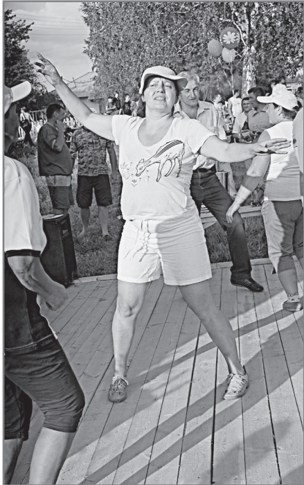
В День поселка танцуют все!

В завершение Дня поселка в Сарапулке жители отплясывали на дискотеке с группой «Ночной квартал» и наблюдали в ночном небе организованный на средства спонсоров фейерверк.