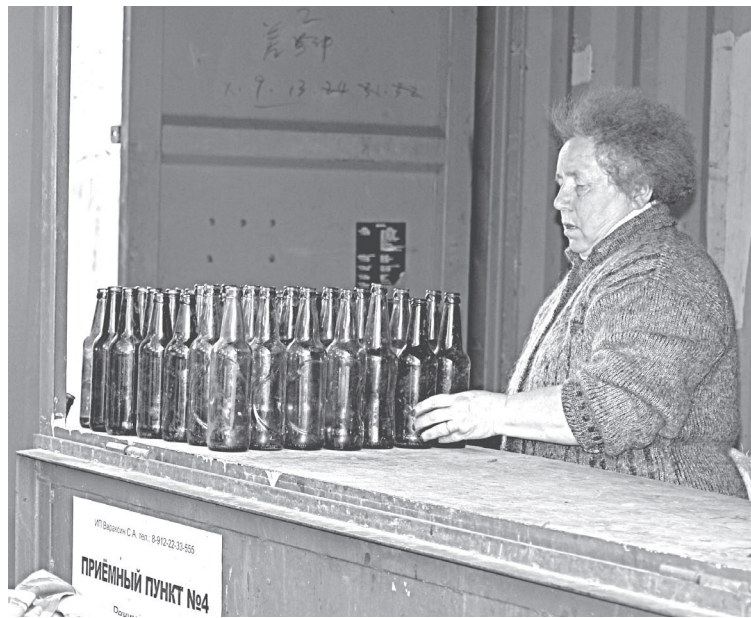
«Результативно» проходит кое для кого лето в Березовском...