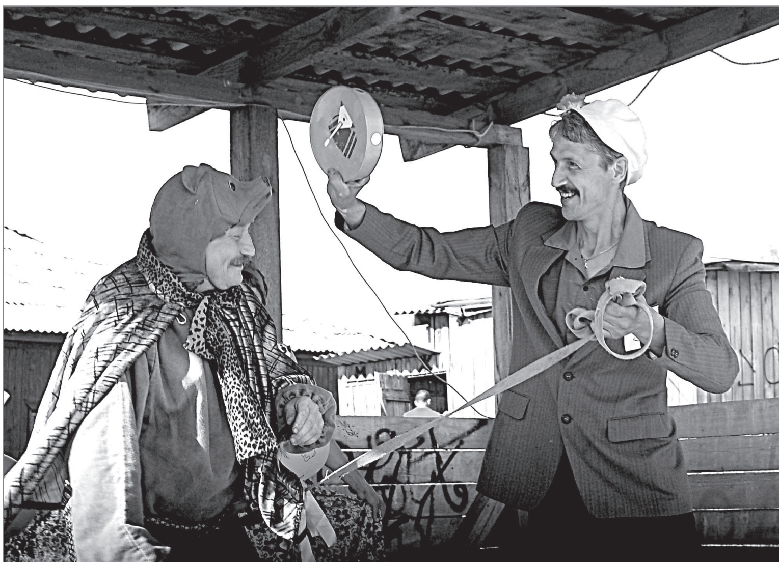
Сарапульский карнавал героев сказочных собрал