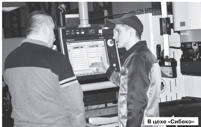
В цехе «Сибек»

– Да, мы четко фильтруем заявки на займы, но представлять нас жестокими коллекто-