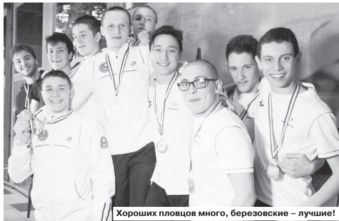
Хороших пловцов много, березовские – лучшие!

Столько медалей кубков мира наши спортсмены еще не привозили домой. Поздравляем ребят с успешным выступлением!