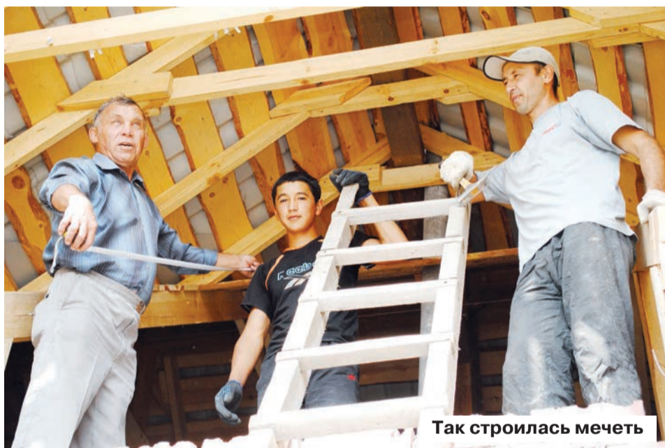
Так строилась мечеть

10 лет назад, 29 января 2007 года, в Берёзовском торжественно открылась долгожданная мечеть. Первый бетонный замес сделали, и первую молитву на месте будущего храма прочитали еще 11 сентября 2001-го. К стати, в конце тридцатых годов прошлого века в течение двух с половиной лет здесь, на Советской, 9, располагалась неполная татарская школа № 110 (прежде это был лишь один разновозрастный класс в школе № 6), а первые ее ученики получили аттестаты на... латинице. Все предметы преподавали на татарском языке, но ни арабского, ни уроков ислама в расписании занятий не было. В 1939 году по указанию Сталина все национальные школы страны закрылись. В пятидесятые годы в двухэтажном деревянном здании поселили детскую музыкальную школу, после – мастерскую «Сапожок». А потом ветхий дом снесли.