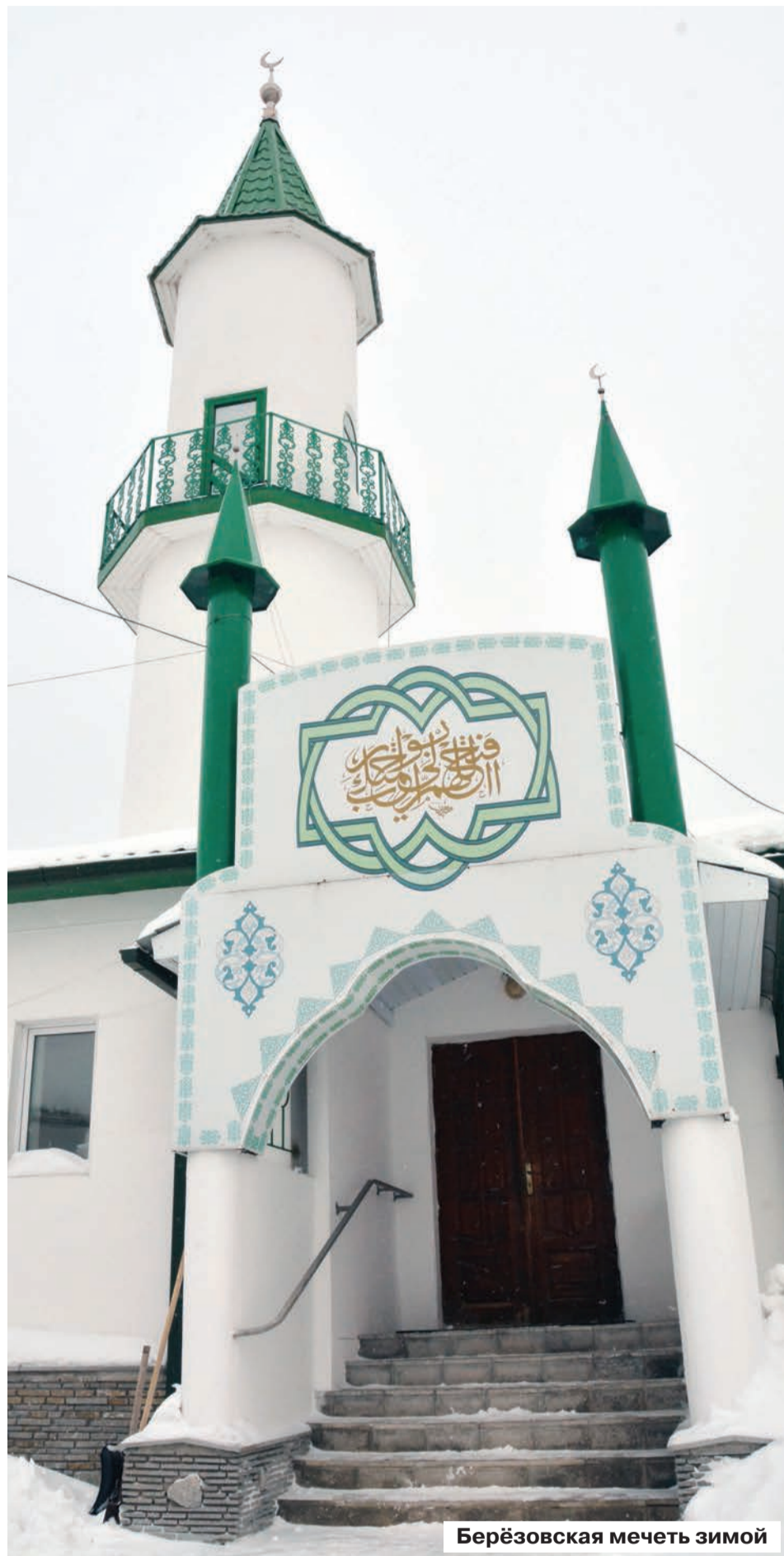
Берёзовская мечеть зимой

Берёзовские мусульмане поддерживают связи с единоверцами из соседних городов: в декабре на базе нашей мечети прошел молодежный брейн-ринг, посвященный Мавлиду, и съезд мусульманок Свердловской области.