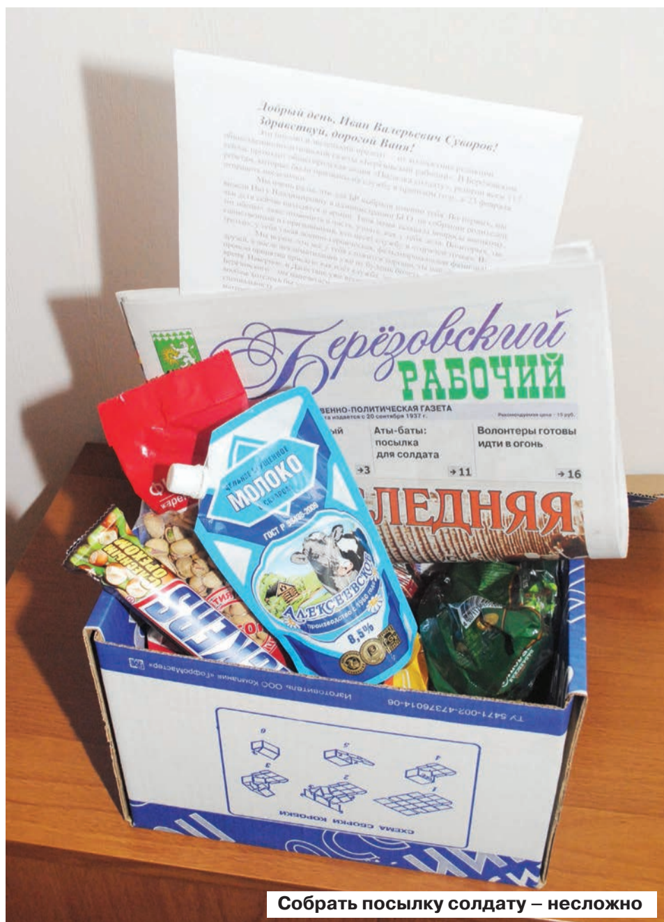
Собрать посылку солдату – несложно

Чтобы получить адрес военнослужащего, нужно позвонить в комитет солдатских матерей по телефону: 8-904-167-74-48.