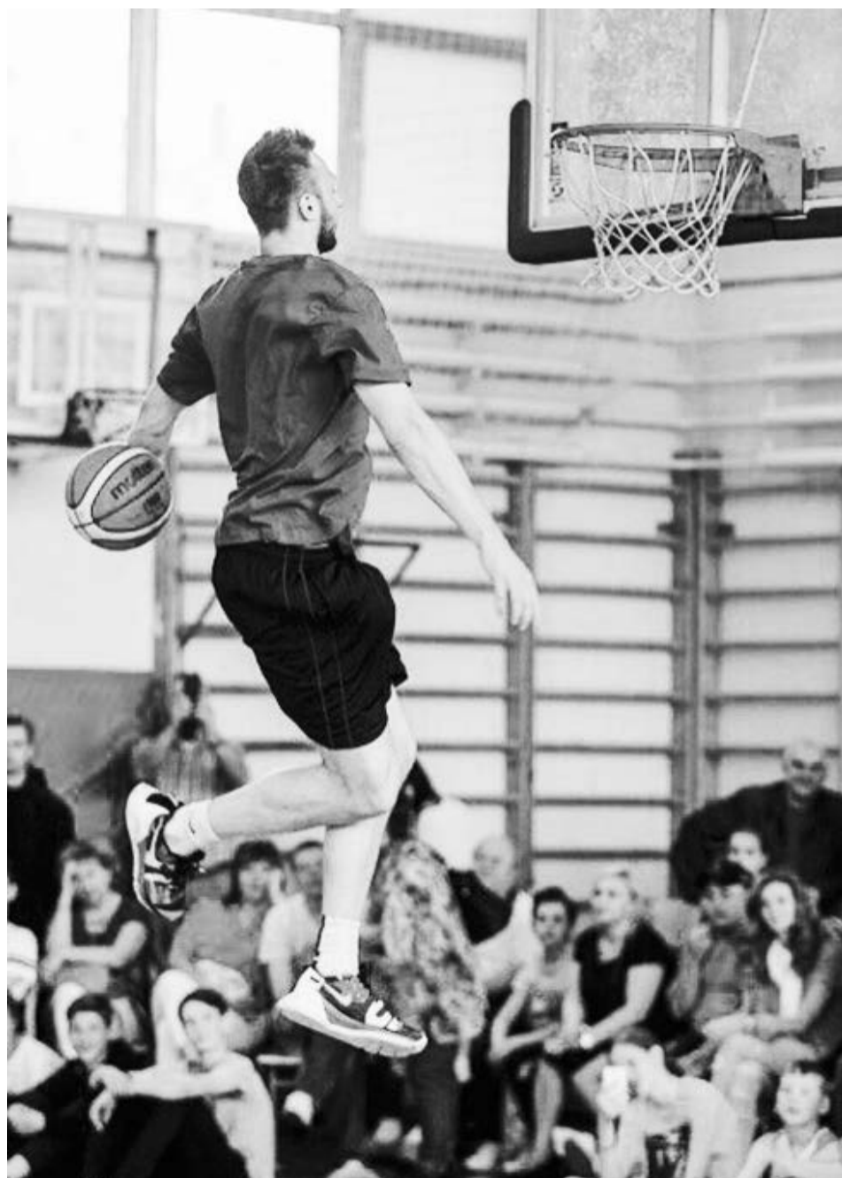
Подготовил Анатолий МЕЛЬНИК

После окончания второго круга начнутся игры по системе плей-офф, где и определятся призеры.