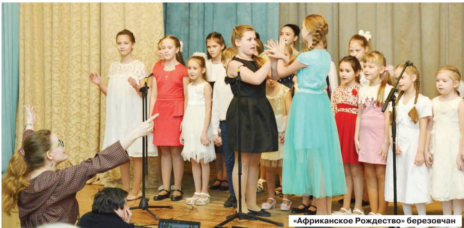
«Африканское Рождество» березовчан

15 из первоначально заявленных 16 коллективов выступили на первом городском конкурсе хоров, состоявшемся в субботу в ДШИ № 1 в рамках третьих муниципальных Рождественских чтений «Уроки истории». Последний момент накладывал определенные обязательства по выбору репертуара, но некоторые участники его просто проигнорировали.