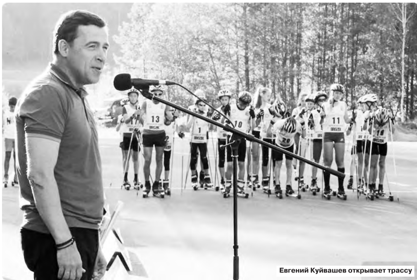
Евгений Куйвашев открывает трассу

Спортсмены здесь будут находиться круглогодично: в их распоряжении раздевалки оздоровительного лагеря, летом – и столовая, в спальнях корпусах реально разместить более 200 человек. Кстати, нынче приняли первых 64 отдыхающих два отремонтированных одноэтажных корпуса, которые смог оценить и Евгений Куйвашев. В палатах – по восемь кроватей, есть свои санузлы с душевыми кабинками, поэтому маль-