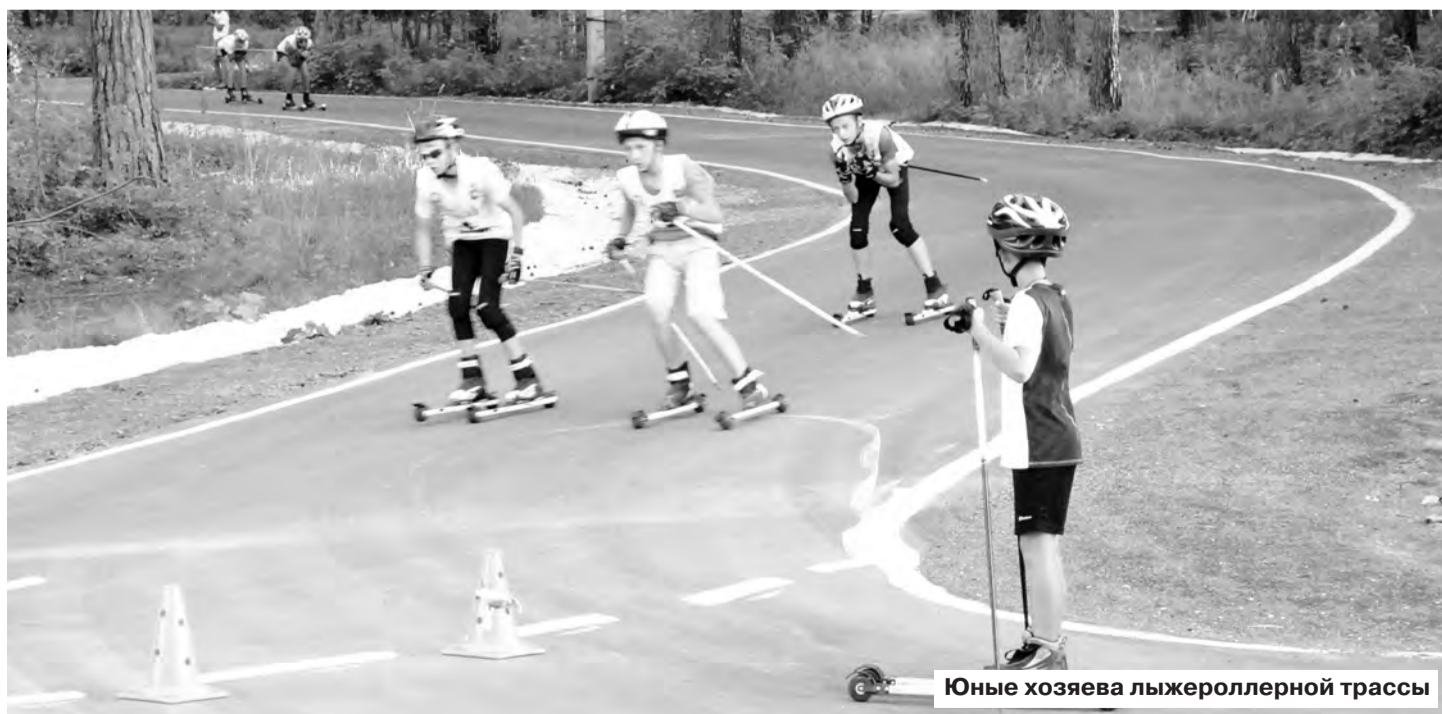
Юные хозяева лыжероллерной трассы

трасса спорткомплекса «Динамо». Но вы же понимаете: она не резиновая. Поэтому второй аналогичный объект в Берёзовском значительно разгрузит «Динамо». Трасса ориентирована на детей: профессионалов и чемпионов можно получить, лишь воспитывая их с младых ногтей. Каждый такой шаг работает на пропаганду лыжного спорта. Я сам сначала считал, что ежегодная «Лыжня России» – малополезные старты, но потом понял, что это очень нужный праздник: сначала люди просто приходят по «просьбе» начальства, а потом уже всей семьей в выходной день отправляются в зимний заснеженный лес размять мышцы, подышать кислородом. У скандинавов лыжные гонки и биатлон в приоритете, в национальной крови. Там лыжник может ехать прямо по автодороге – и все с пониманием отнесутся к этому. У нас вряд ли такое возможно... Мне очень важно, чтобы люди поняли: лыжные гонки – не лошадиный, а очень