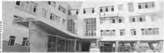
Новых школ будет больше.

В настоящее время в Екатеринбурге идёт строительство второй очереди школьного комплекса в Академическом районе, в посёлке Мичуринский возводится образовательный центр, а в Полевском – пристрой к школе №14.