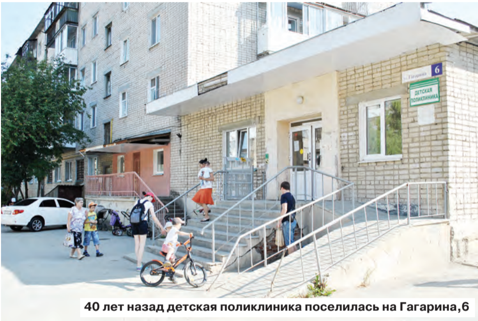
40 лет назад детская поликлиника поселилась на Гагарина, 6

О многолетних страданиях родителей и бабушек маленьких берёзовчан, вызванных проблемами детской поликлиники ЦГБ, знают не только местные чиновники, члены Общественной палаты, но и губернатор, областной министр здравоохранения и даже аппарат президента России: наши землячки обратились на «Прямую линию» с Владимиром Путиным, которая состоялась 15 июня.