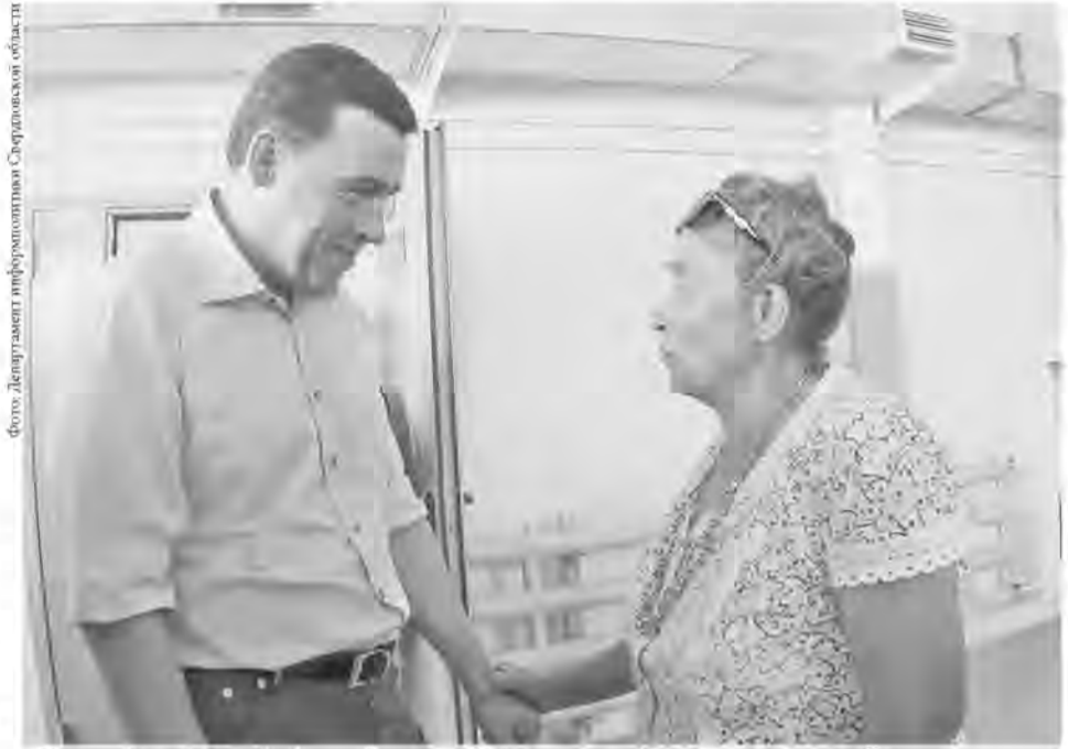
Учреждённый главой области Евгением Куйвашевым в 2013 году праздник – День пенсионера – стал социально значимой инициативой, получившей широкую поддержку уральцев.

На теплоходе «Александр Фадеев» в сентябре 2017 года 65 человек отправятся в Самару, Саратов, Волгоград, Елабугу, Ульяновск, Саранул. Они проведут встречи с ветеранами, молодёжью, представителями органов власти, возложат цветы, венки к памятникам, обелискам.