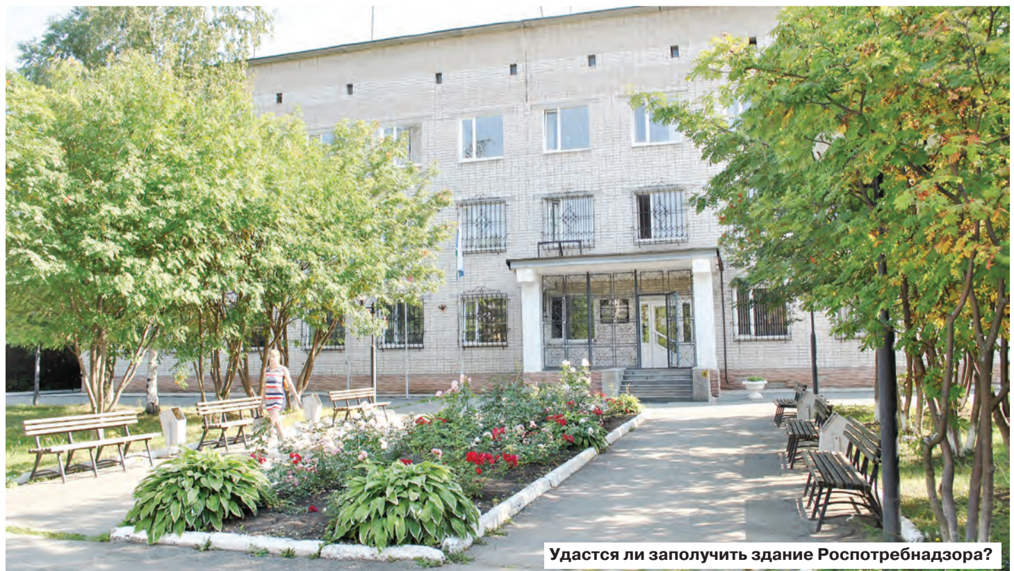
Удастся ли заполнить здание Роспотребнадзора?

Речь зашла и о высокотехнологичных операциях. На наш вопрос, есть ли возможность на базе ЦГБ развивать это направление хирургии, министр ответил: смысла нет, поскольку такие операции поставлены на поток в специализированных клиниках, и в Свердловской области на них очереди отсутствуют. И пошутил: «как говорят наши хирурги, всех больных уже вырезали».