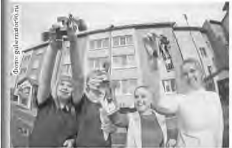
Департамент информполитики Свердловской области

Ключи от новых квартир в микрорайоне «Южный», построенных по программе переселения из ветхого жилья, получили 57 талицких семей. Рядом есть детсад, газовая котельная, в планах – строительство школы. «С новоселья начинается новая жизнь. Пусть в ваших квартирах всегда звучит детский смех», – поздравил новосёлов глава региона Евгений Куйвашев . Напомним, с 2015 года из областного бюджета на обеспечение жильём горожан выделено 372 млн рублей.