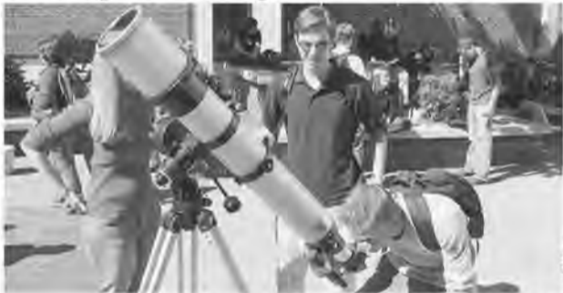
Старшеклассникам расскажут о звездах.

Одним из нововведений в 2017-2018 учебном году станет появление в школьном расписании астрономии. Как отмечают в региональном министерстве образования, пока не внесены изменения в базисный учебный план, но рекомендации министерства образования и науки России уже доведены до школ. Планируется, что новая дисциплина по решению школ появится в расписании учеников 10-11 классов. Предполагается, что повышение квалификации педагогов будет проводиться в Институте развития образования Свердловской области.