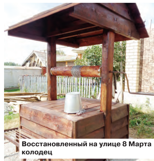
Восстановленный на улице 8 Марта колодец

– За 17 лет в Берёзовском городском округе получили вторую жизнь около 100 родников, колодцев и лесных ключиков, – комментирует главный специалист по экологии