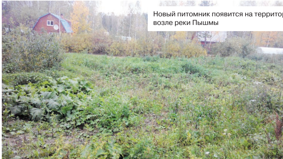
Новый питомник появится на территории одного из садовых товариществ возле реки Пышмы