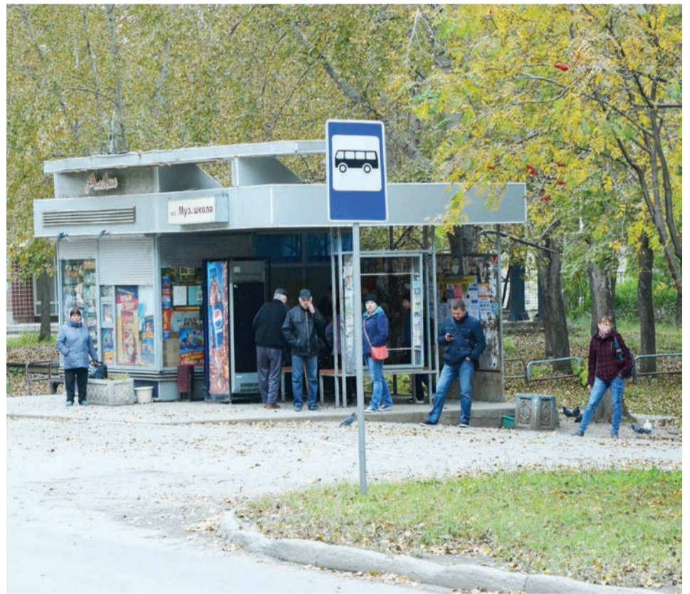
Эти остановочные комплексы будут снесены

временная дельта сноса и конкурса на занятие места новыми предпринимателями будет максимально сокращена.