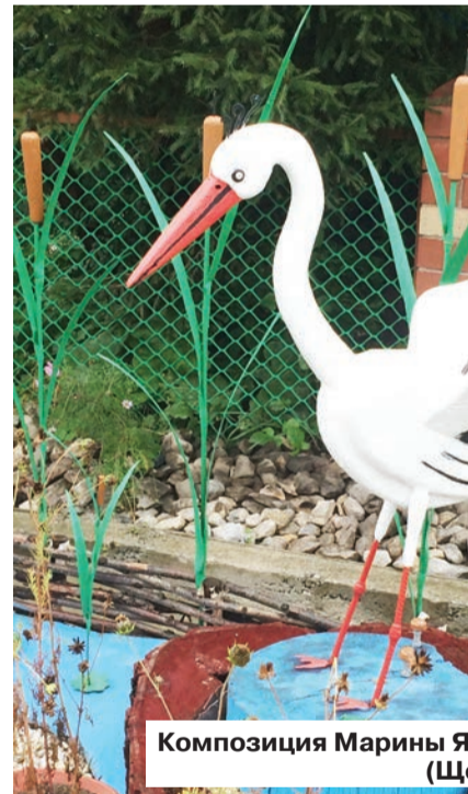
Композиция Марины Я (Щ)