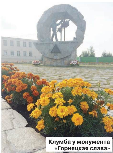
Клумба у монумента «Горняцкая слава»