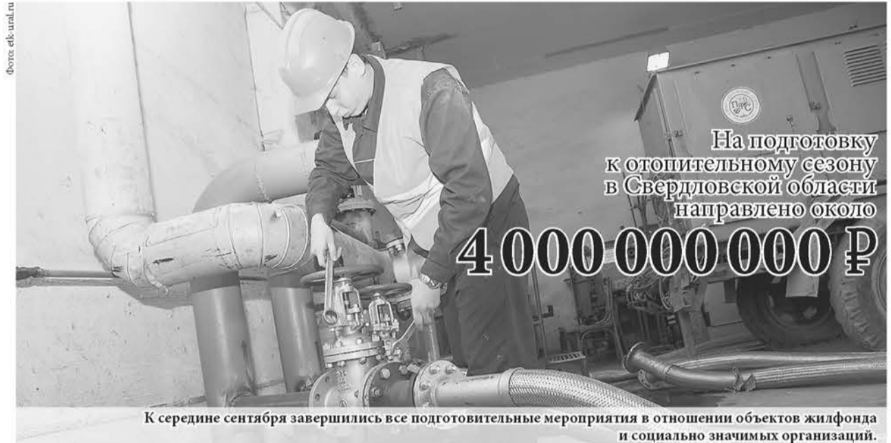
К середине сентября завершились все подготовительные мероприятия в отношении объектов жилфонда и социально значимых организаций.

(пн-пт с 08:30 до 17:30, в пт с 8:30 до 16:15).