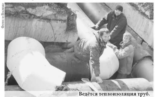
Ведётся теплоизоляция труб.

На главный вопрос «о парилке» специалист ответил, что свою работу они выполняют качественно и отвечают за неё стопроцентно. Проблема горожан решается, а это значит, что власти действуют в правильном направлении теплосбережения.