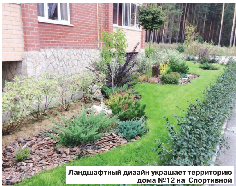
Ландшафтный дизайн украшает территорию дома №12 на Спортивной