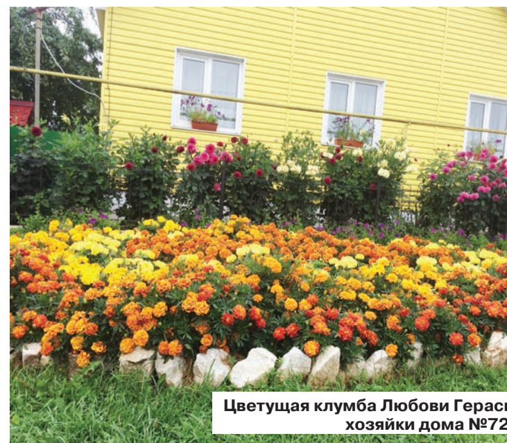
Цветущая клумба Любови Герасовой хозяйки дома №72