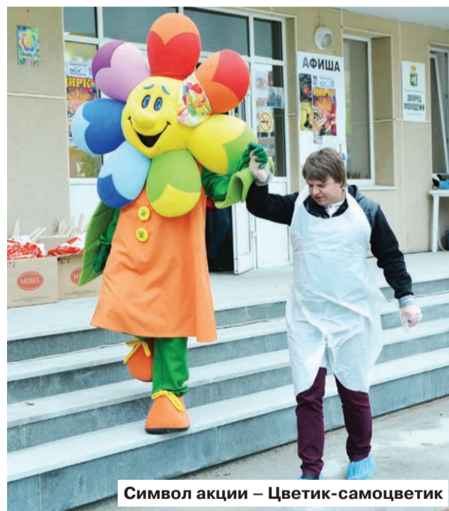
Символ акции – Цветик-самоцветик