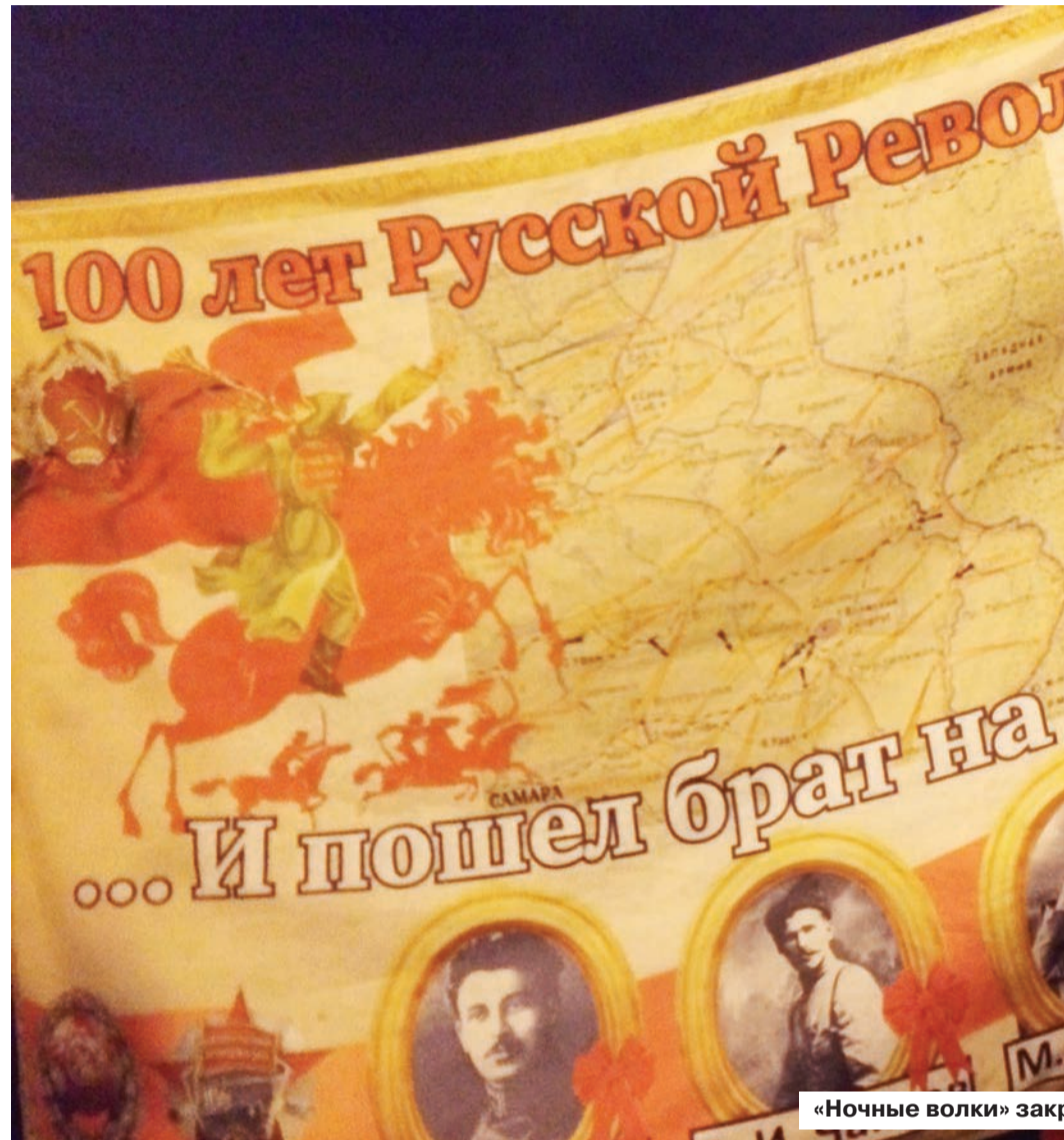
«Ночные волки» закр