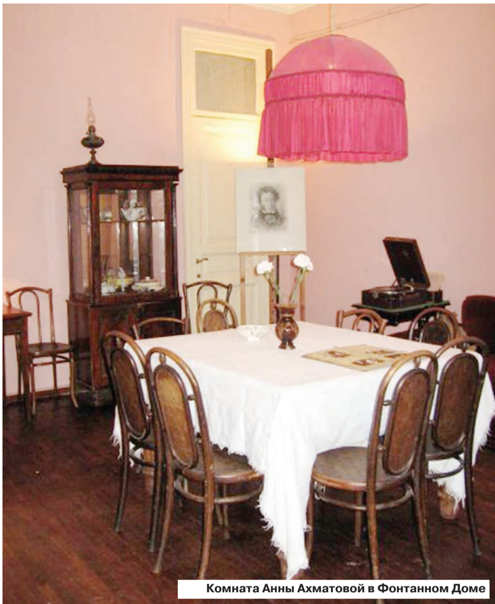
Комната Анны Ахматовой в Фонтанном Доме

Здесь сегодня стоят восковые фигуры участников заговора – поручика Сухоти-