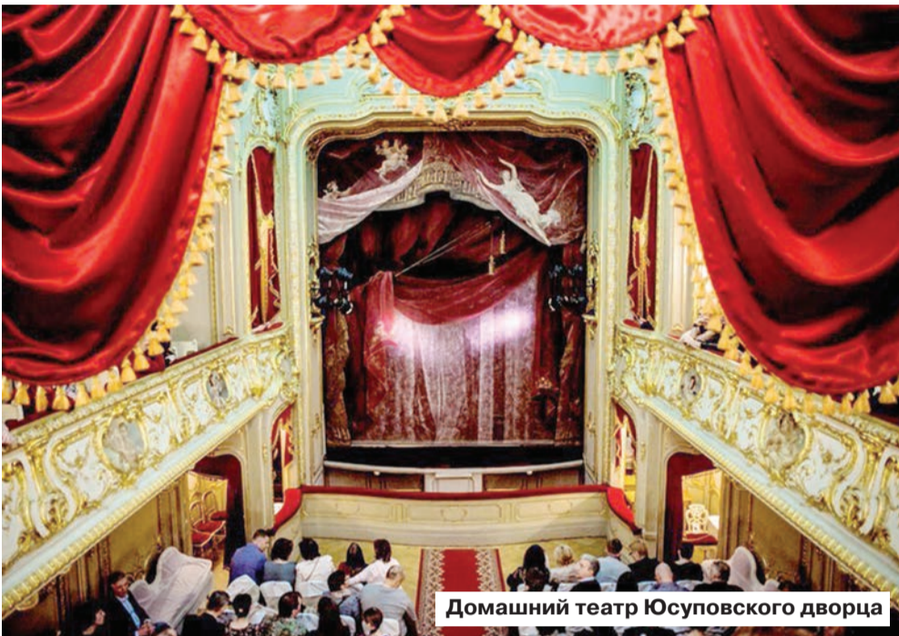
Домашний театр Юсуповского дворца