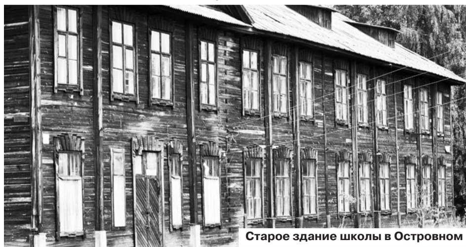
Старое здание школы в Островном

Как подтвердил спикер Думы Евгений Говоруха, жалоб по поводу яркой рекламы от избирателей приходит немало. Интересно, какой выход найдут нардепы, а также КУИ и отдел архитектуры, которые дают добро на установку всякого рода вывесок.