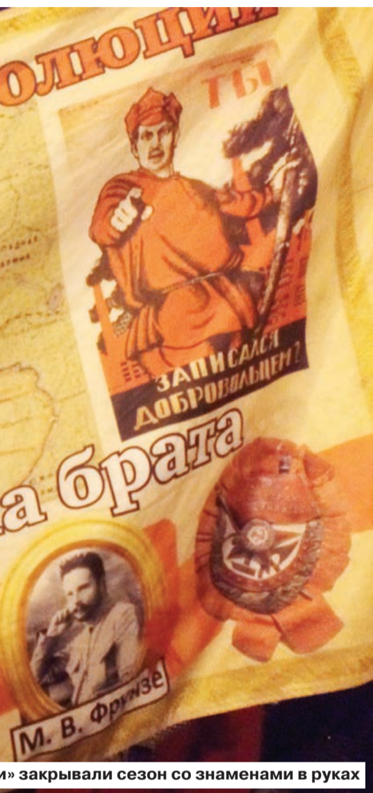
«Закрывали сезон со знаменами в руках»