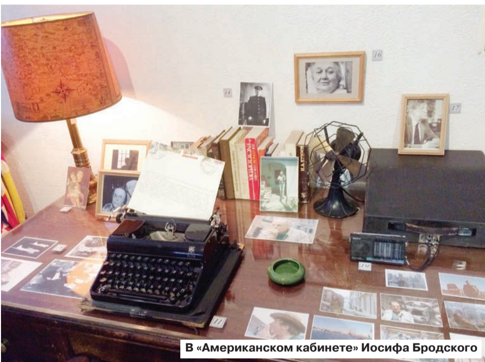
В «Американском кабинете» Иосифа Бродского