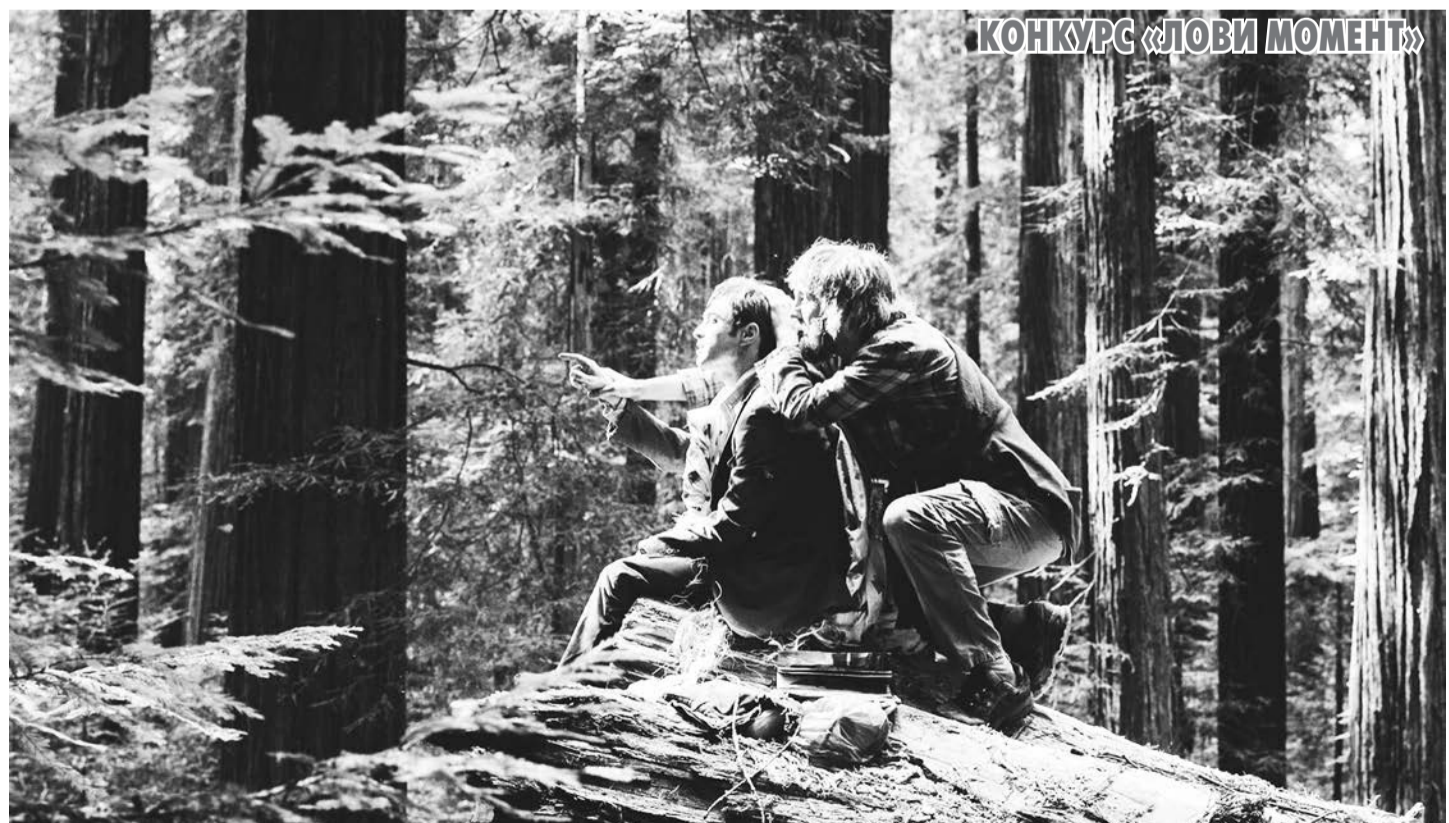
КОНКУРС «ЛОВИ МОМЕНТ»