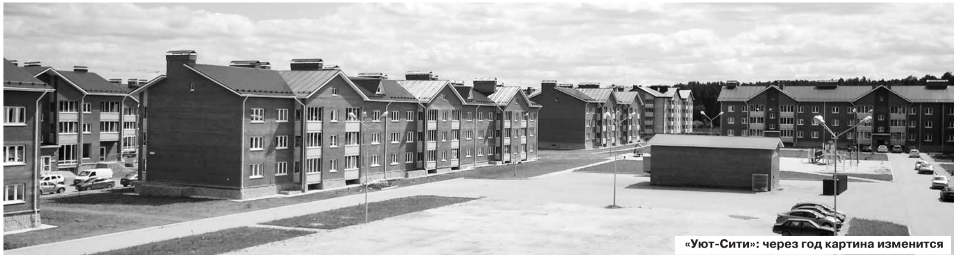
«Уют-Сити»: через год картина изменится