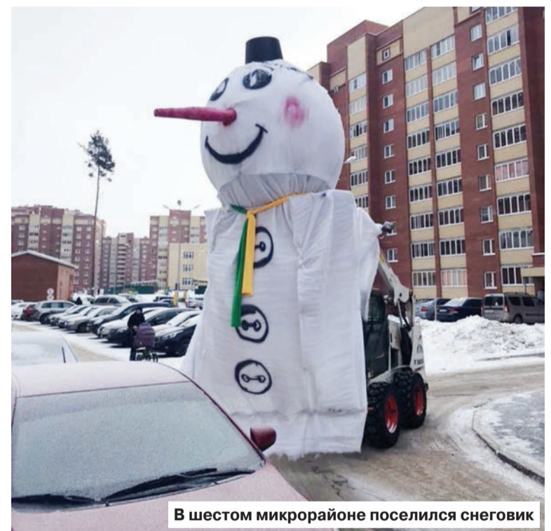
В шестом микрорайоне поселился снеговик