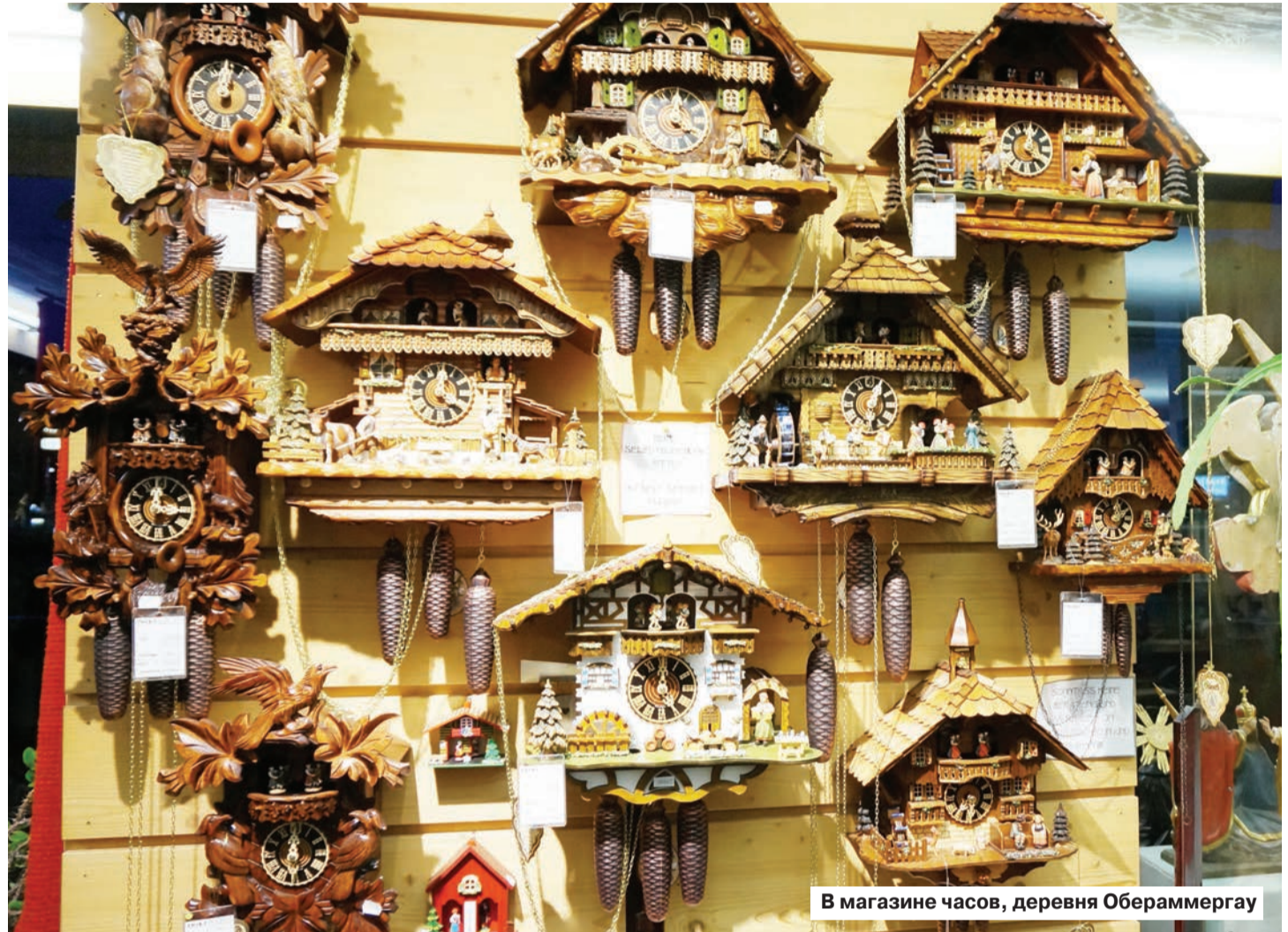
В магазине часов, деревня Обераммергау

А за окном машины – классический пейзаж с бело-рыжими коровами, жующими даже в ноябре сочную траву лугов. Они рады первому снежку: более взрослые охотно ложатся на него, как на перину, молодые вовсе скачут, будучи телята неразумные... Коров и прочую живность баварцы почитают: для нее даже построена здесь церквушка, в