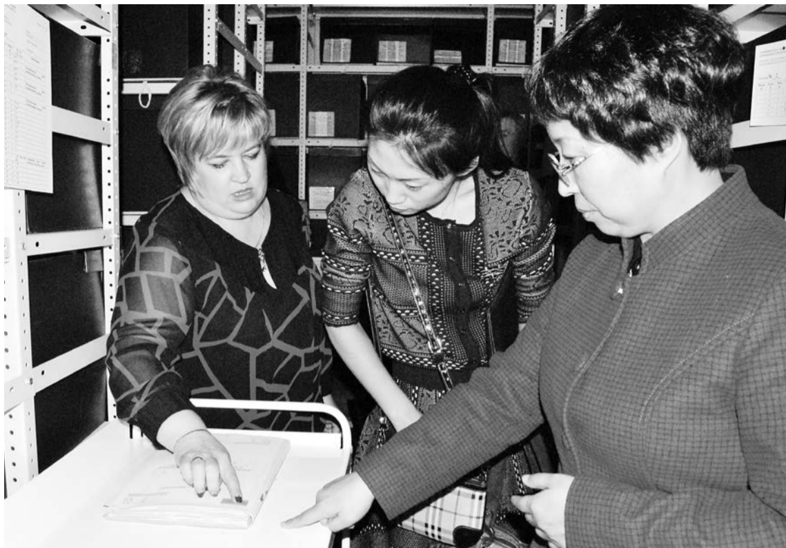
В апреле прошлого года в гостях у берёзовских архивистов побывали их коллеги из провинции Хэйлуцзян Китайской Народной Республики, которые изучали опыт архивного дела в России.

С бумажных носителей в «цифру» на сегодня переведены все описи дел: работа