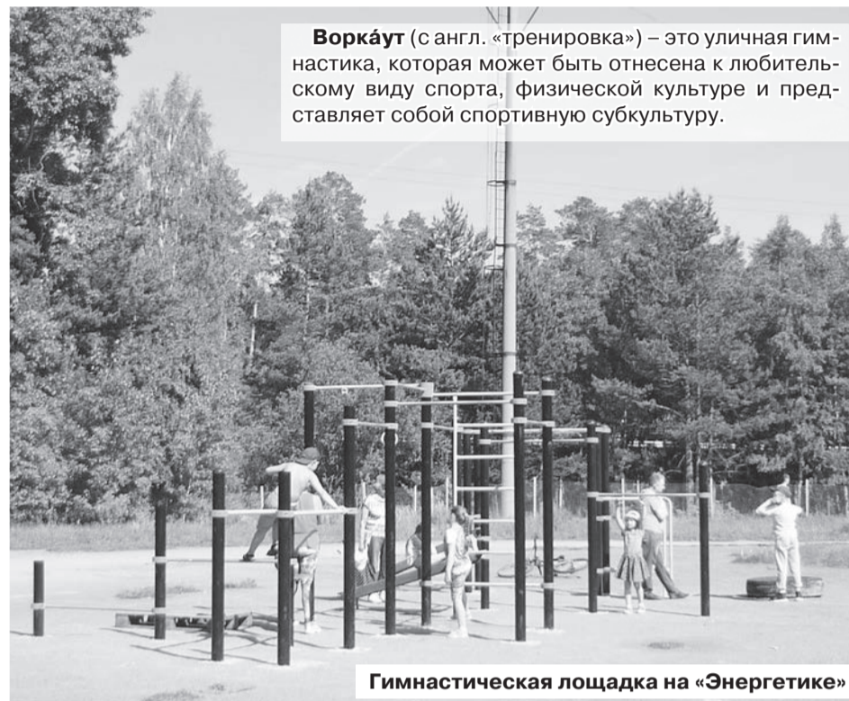
Воркаут (с англ. «тренировка») – это уличная гимнастика, которая может быть отнесена к любительскому виду спорта, физической культуре и представляет собой спортивную субкультуру.

«Энергетик» при ближайшем рассмотрении оказался и таким, и не таким, как его описали редакции по телефону местные любители активного образа жизни. Поле более-менее ухожено, мусора на нем не было, здание не выбивалось из пейзажа, портили картину нескошенная трава на газонах,