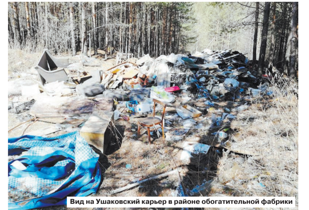
Вид на Ушаковский карьер в районе обогатительной фабрики

Будут модернизированы заводы в Первоуральске, Каменске-Уральском, небольшие линии появятся в Асбесте, Байкалово, в Краснофимске построят новый полигон вместо старого. Но на