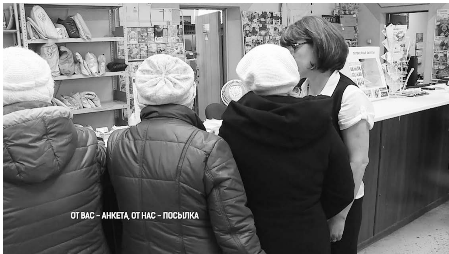
ОТ ВАС – АНКЕТА, ОТ НАС – ПОСЫЛКА

Везде выбрав ответ «нет» и благополучно получив свою посылку, я решила твердо больше на Почту России не ходить. Я ничем не обязана этому