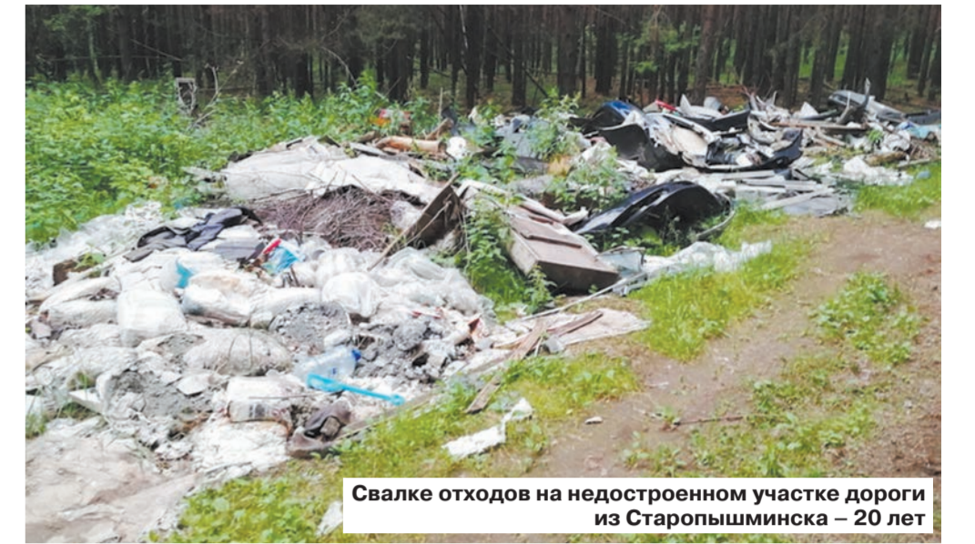
Свалка отходов на недостроенном участке дороги из Старопышминска – 20 лет

В будущем у нас появятся 13 мусоросортировочных комплексов, так, в Нижнем Тагиле – на 185 тысяч тонн, еще один в Краснотурьинске, в Новоуральске откроется линия на 50 тысяч тонн, два завода на 800 тысяч тонн с полигоном построят для переработки ТКО Екатеринбург, Берёзовского, Верхней Пышмы, Среднеуральска, Дегтярска и Двуреченска.