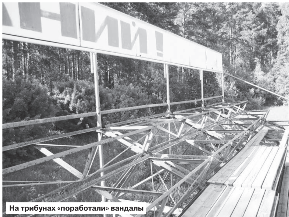
На трибунах «поработали» вандалы

В настоящее время мы изучаем практику других муниципалитетов по созданию современных спортивных площадок, чтобы нам привлечь на стадион людей разного возраста.