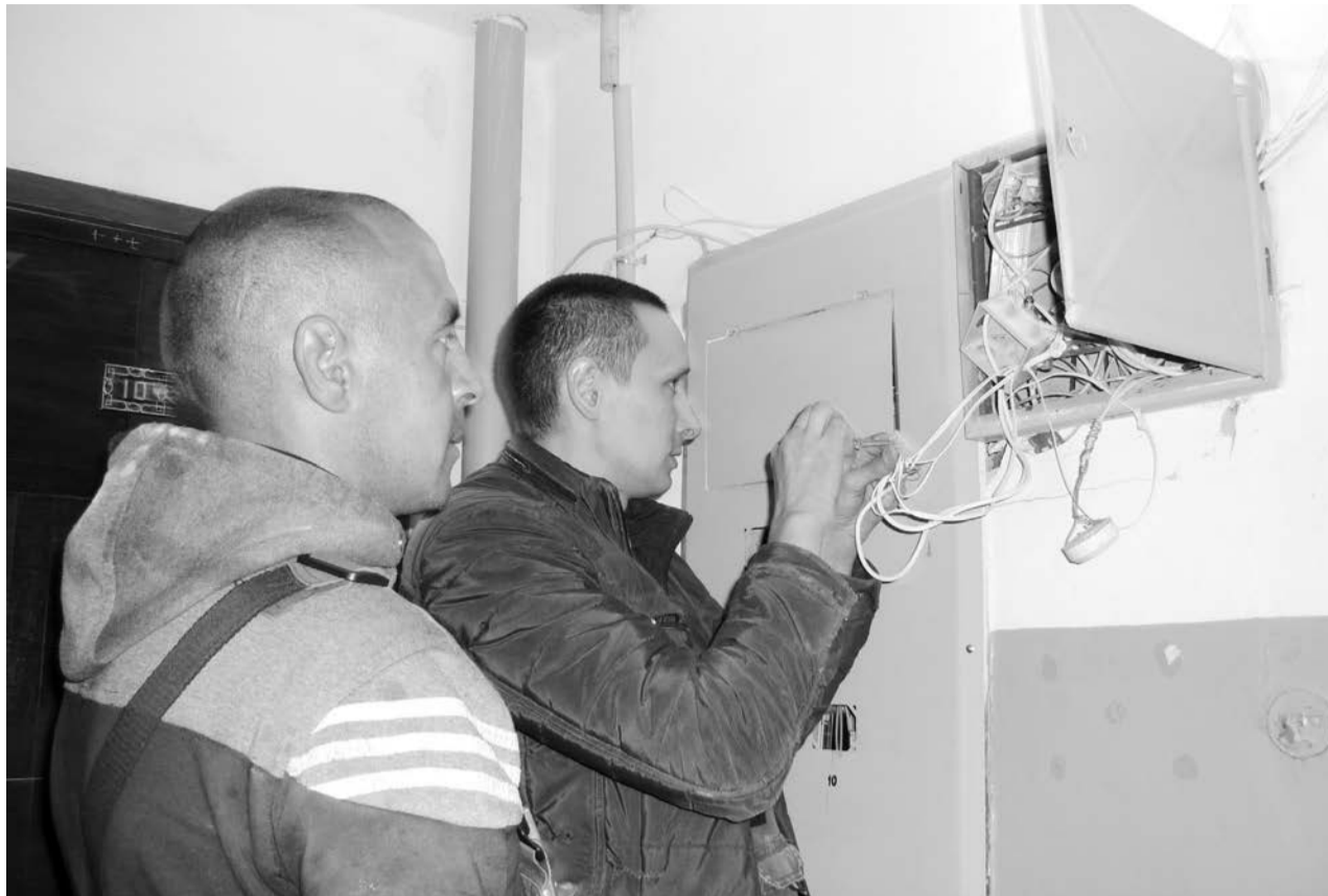
Совет дома на Энергостроителей, 3, подписал допсоглашение с управляющей компанией ООО «ЖКХ-Холдинг» на установку нового домофонного оборудования с условиями: деньги на установку – с текущего ремонта и никакой абонентской платы после. УК наняла подрядчика. «Сотрудники «Планеты связи» в понедельник, 17 июня, приступили к работе.