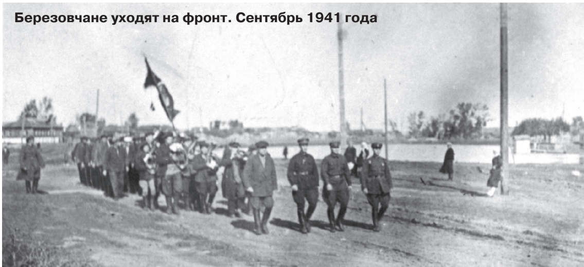
Березовчане уходят на фронт. Сентябрь 1941 года

К ак начиналась война, почему у нас были неоправданно большие потери в 41-м году, что говорит статистика о конце войны, когда мы научились воевать... С таких вопросов я начал разговор с ребятами в сарапульской школе в преддверии Дня Победы. Народ на классный час собрался разновозрастный и открытый. По тому, как дети весь урок слушали и, главное, задавали вопросы и комментировали мой рассказ, было ясно, что говорить с детьми на тяжелые темы и можно, и нужно. Ведь отечественная история – связующая нить между разными поколениями.