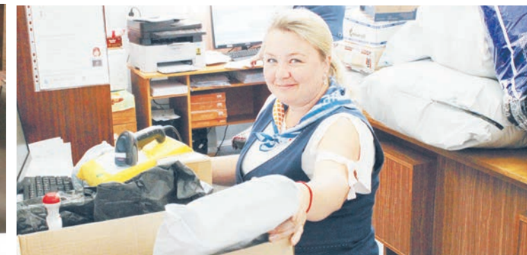
● Каждое утро в отделении начинается так: ловкие женские руки раскладывают из огромных мешков, привезенных из Екатеринбургского главпочтамта, всю корреспонденцию, разделяя почту на три категории – простую, страховую и заказную